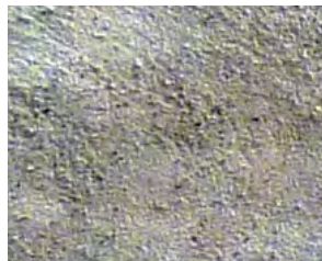
Enduit brossé couvrant