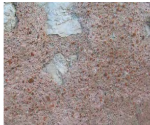
Enduit au mortier de tuileau

Les enduits sont la peau de la façade, c'est leur ruine qui a fait apparaître les moellons. À l'exception de la Beauce, la majorité des bâtiments traditionnels réalisés en maçonnerie dans le département présente des enduits à la chaux naturelle couvrant totalement les maçonneries. En effet, bien que les murs aient été construits en pierres calcaires et rognons de silex, la qualité médiocre des liants ne permettait pas de laisser les parements exposés aux vents chargés de pluie. Une protection était nécessaire sous la forme d'un enduit de chaux naturelle couvrant. Dans la plupart des cas, les seules pierres qui doivent rester apparentes sont des pierres appareillées (chainages, encadrements,...). En général, l'enduit affleure les pierres d'encadrement et de chaînage.