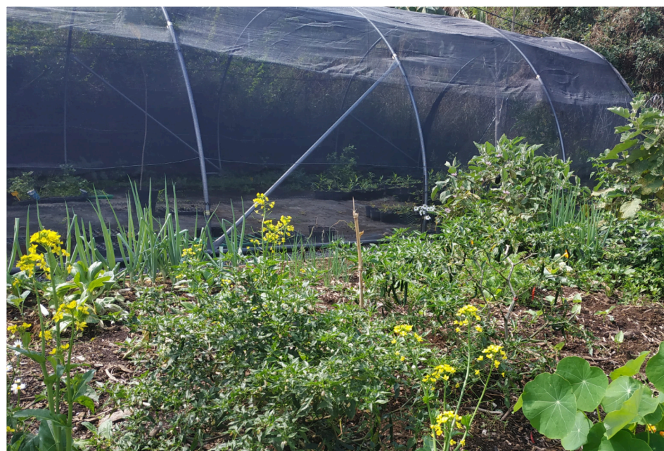
Serre où sont réalisés les semis au Jardin d'Amédée .

Elle prévoit l'achat d'une serre dans laquelle les jardiniers pourront, après avoir récolté les graines, réaliser leurs propres semis : c'est le principe des semences paysannes.