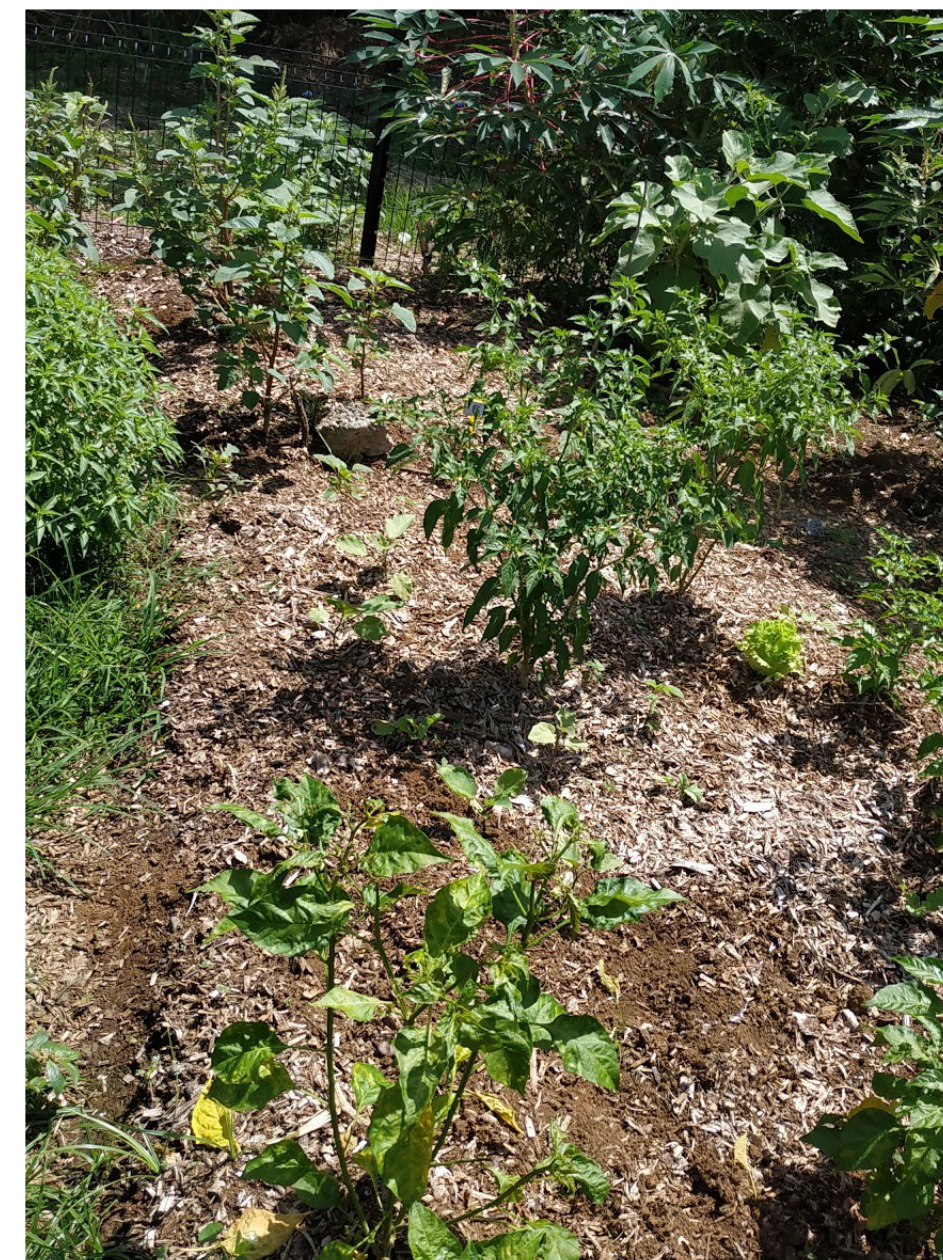
Dépôt de copeaux de bois sur les parcelles du Jardin de l'Europe .

L'association ABDESS sur le Jardin de l'Europe récupère gratuitement des copeaux de bois auprès d'un élagueur pour mulcher les sols. C'est une démarche "gagnant-gagnant" car l'entreprise n'a pas besoin de payer l'évacuation de ses copeaux en déchetterie.