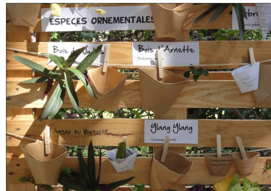
Grainothèque du CAUE de La Réunion

À noter que l'importation de graines est réglementée à La Réunion et ne doit en aucun cas se faire sans l'autorisation de la DAAF (Direction de l'Alimentation, de l'Agriculture et de la Forêt).