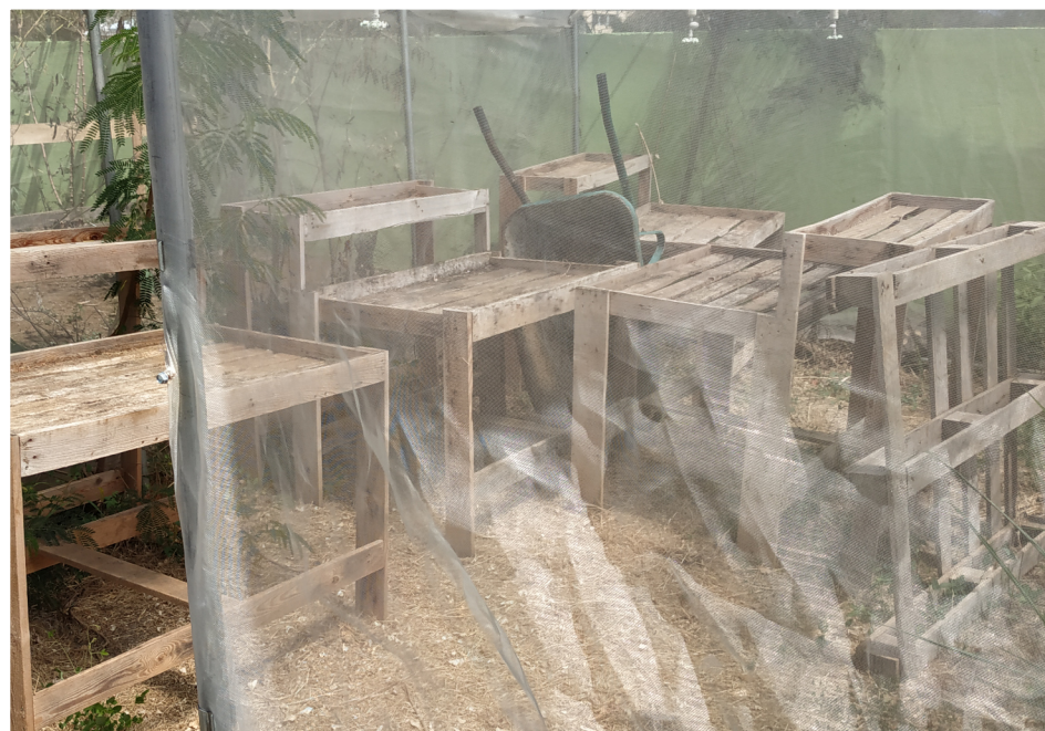
Serre et tables de semis en palette du Jardin d'insertion de Primat

L'achat d'une serre fait partie des projets du Jardin de l'Olivier à Bois d'Olive, géré par l'association AJC. D'autres jardins en sont également équipés pour les semis : le Jardin de Primat à Saint-Denis, le Jardin Eucalyptus à La Saline ou encore le Jardin d'Amédée à Sans-Souci.