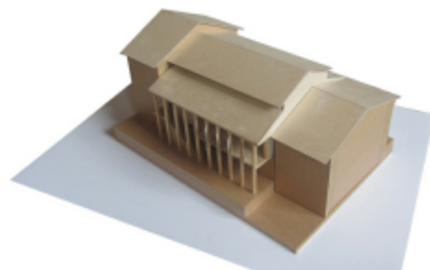
Habiter: entre pierre et bois