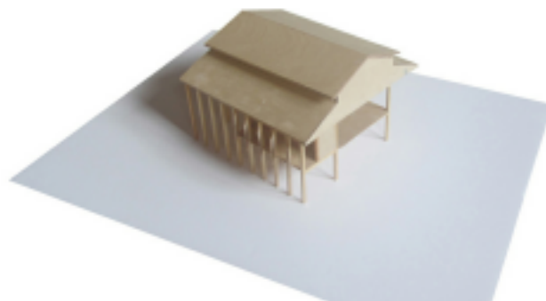
La nouvelle charpente