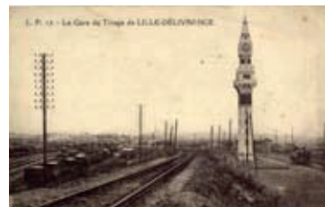
La gare de triage

Vers 1922. Le photographe se trouve du côté de Sequedin, sur le terre-plein de la voie de circulation machine. Derrière le mirador, c'est le faisceau du relais. A gauche, le triage qui sert à la formation des trains.