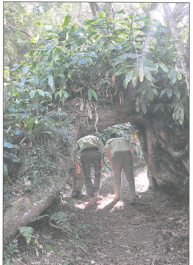
Un tamarin des hauts forme une arche sur le sentier.

Sur les troncs des fanjans endémiques, plus nombreux ici que dans la forêt des hauts de l'Ouest, poussent de petits Tan Rouge ( weinmannia tinctoria ). En effet cette espèce fait partie des plantes hémipiphytes, les graines germent dans le milieu humide des pieds de fanjans avant que les jeunes poussent ne plongent leurs racines dans le sol. « Sur quatre ou cinq un seul va survivre et planter ses racines dans le sol », précise le forestier en soulignant que l'on trouve encore une dynamique forestière malgré les longoses.