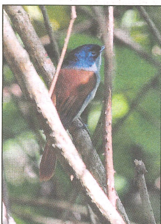
La forêt abrite de nombreux oiseaux comme cet oiseau la vierge.