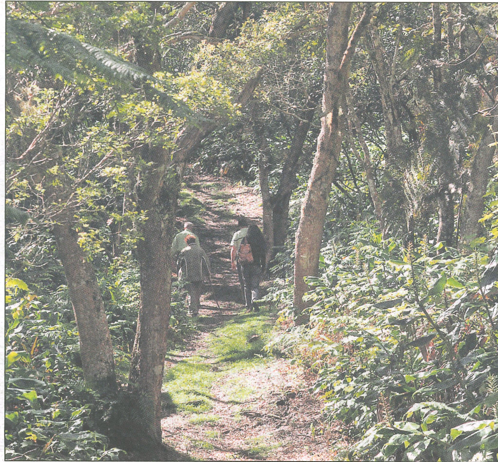
Le sentier de la réserve de Grande-Terre chemine au cœur d'une forêt luxuriante.

Malgré la prolifération des longoses, espèce envahissante contre laquelle l'ONF envisage de lutter manuellement dans cette réserve, la forêt recèle une multitude de trésors végétaux. A commencer par d'énormes tan rouge, qui fleuriront bientôt, dont les troncs atteignent près d'un mètre de diamètre, « ce qui est exceptionnel », note Pierre Sigala. Il ajoute que le Tan Rouge a sans doute été sauvé du fait qu'il n'était pas coupé pour faire des meubles, même s'il a été utilisé pour la fabrication des charrettes jusqu'aux années 70.