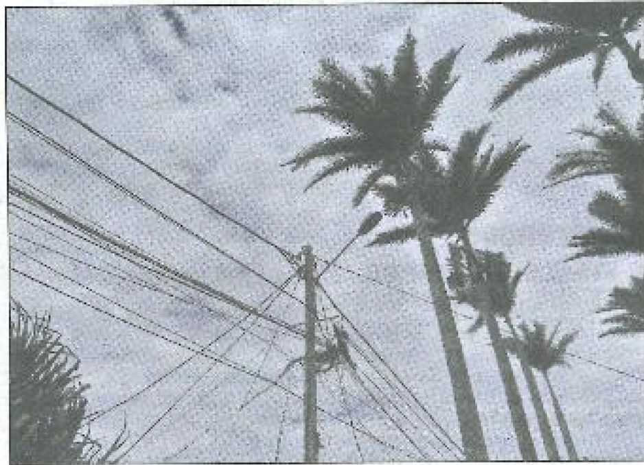
Les palmiers sont, de plus, plantés à proximité immédiate des câbles électriques.

Samedi dernier, suite aux vents violents, un palmier royal d'une quinzaine de mètres est tombé sur le chemin Bassin Bleu, à Sainte-Anne. Heureusement, personne ne se trouvait à proximité. Cette chute inquiète cependant les riverains.