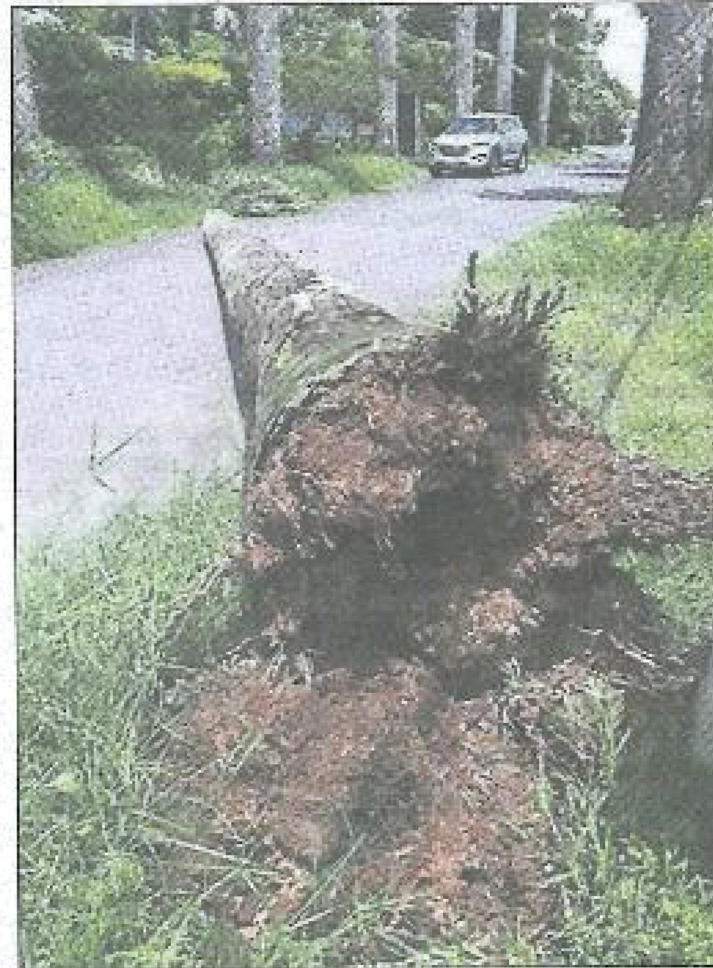
Le palmier est tombé samedi sur la chaussée.

De plus, les arbres menacent aussi les fils électriques: « Il y a une branche qui est dernièrement tombée sur les câbles. Il n'est pas rare d'avoir des coupures d'électri-