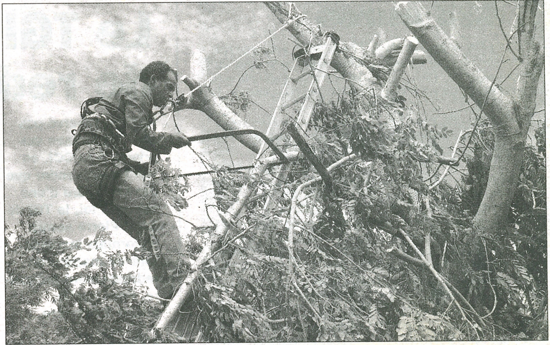
Un élagage, réalisé par un professionnel, sur un arbre de 5 à 10 mètres coûte entre 80 et 500 euros environ, (entre 200 et 400 euros si l'arbre est proche d'une ligne électrique).

Une plaquette d'information est à disposition dans toutes les agences clientèles EDF.