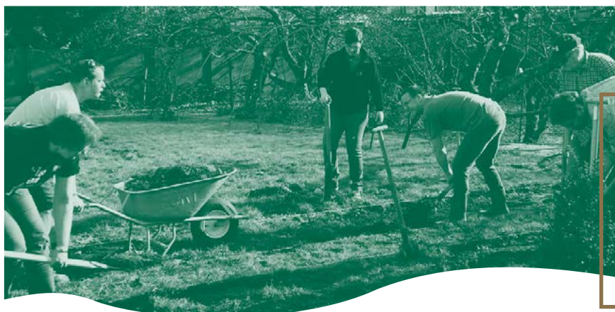
À Kortemark, les habitants travaillaient ensemble dans un jardin; l'accent est sur le 'faire' ensemble.

Vu que tous les porteurs de projets n'ont pas participé de manière aussi intensive au parcours de De Stuyverij, nous disposons de trop peu d'informations pour déterminer dans quelle mesure ces projets ont subi un changement au fil du parcours. Sur la base des entretiens d'évaluation que nous avons pu mener avec une partie des porteurs de projets, voici ce que nous pouvons dire :