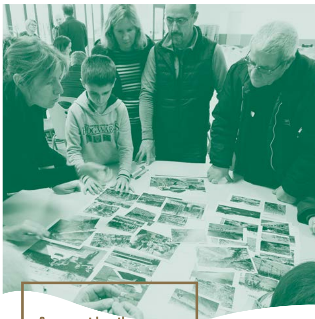
Samen met buurtbewoners nadenken over de ruimte