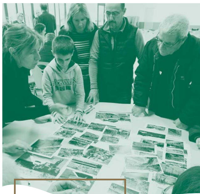
Co-créer l'espace avec les habitants du quartier