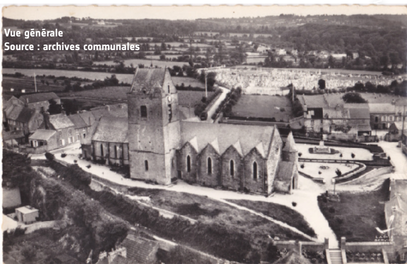
Vue générale

Lien entre l'enclos paroissial de l'église Notre-Dame de Tourlaville et le cimetière un peu plus haut sur le coteau. Une voie bordée d'arbres mène toujours de l'un à l'autre.