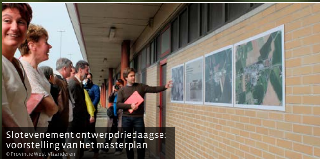
Slotevenement ontwerpriedaagse: voorstelling van het masterplan