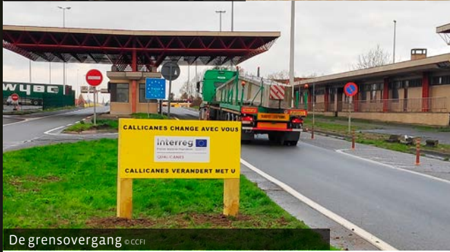
De grensovergang