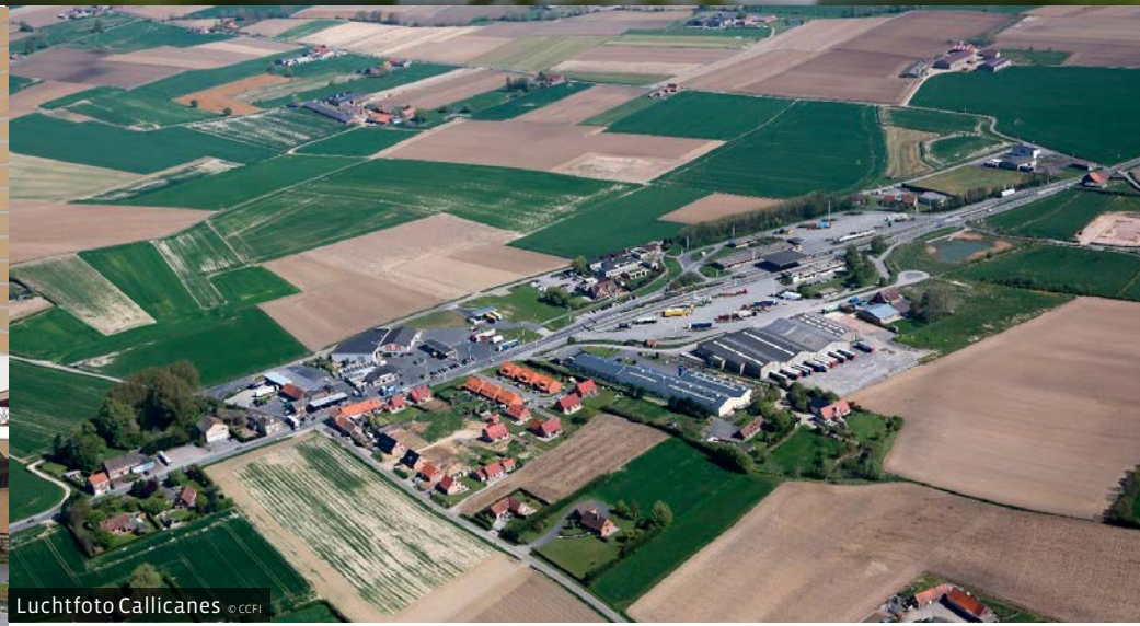
Luchtfoto Callicanes