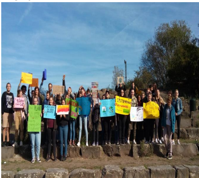
Blaues Heft Projektkurs bei der FFF Demonstration am 20. September 2019