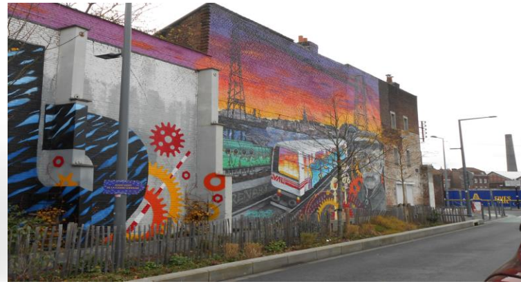
Fresques contemporaines nées d'une collaboration entre habitants et professionnels

Vous observerez également de plus en plus de verdure se mélangeant au paysage urbain.