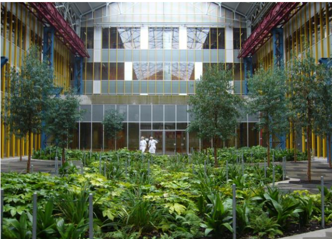
Cour du Lycée Hôtelier International de Lille

Vous observerez également de plus en plus de verdure se mélangeant au paysage urbain.