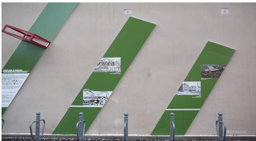
Rue André Ballet, Les panneaux sur l'histoire de l'usine Five Cail

En vous promenant dans ce quartier, vous pourrez observer des vestiges de l'ère industrielle et des panneaux explicatifs pour en apprendre plus sur l'histoire de Fives !