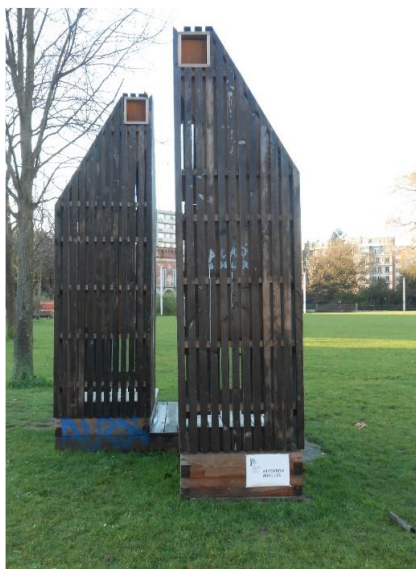
Les ruches du parc Matisse