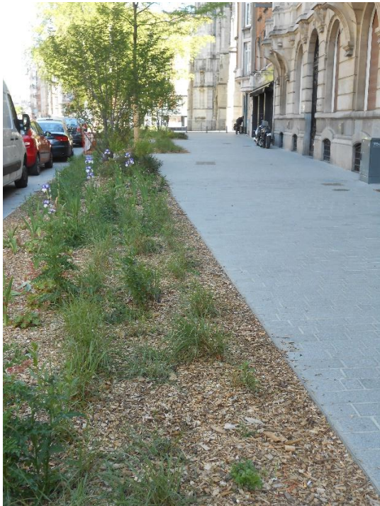
Un trottoir réaménagé