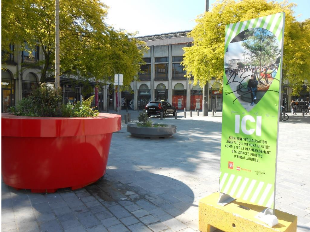
Végétalisation de la place des Buisses, près de la gare Lille Flandres