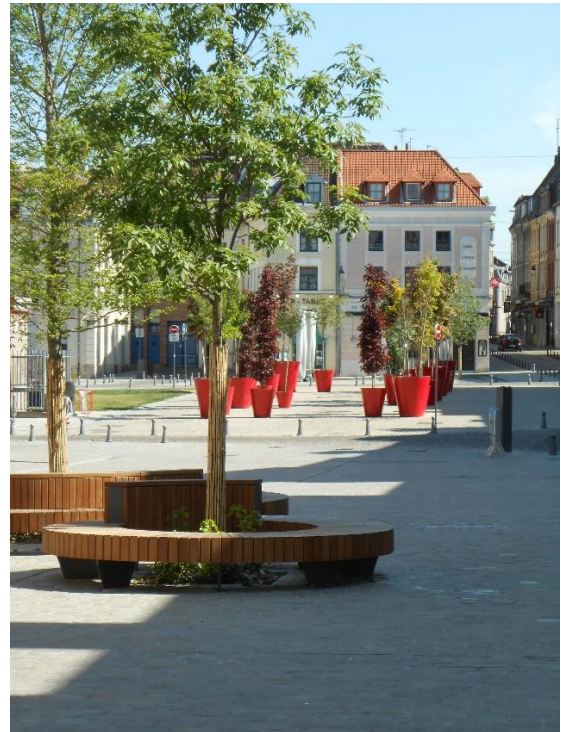
Végétalisation de la place Louise de Bettignies, Vieux Lille