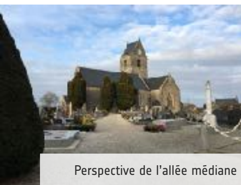
Perspective de l'allée médiane