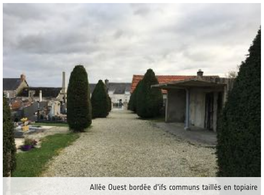
Allée Ouest bordée d'ifs communs taillés en topiaire