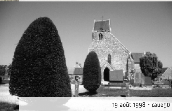
19 août 1998 - caue50