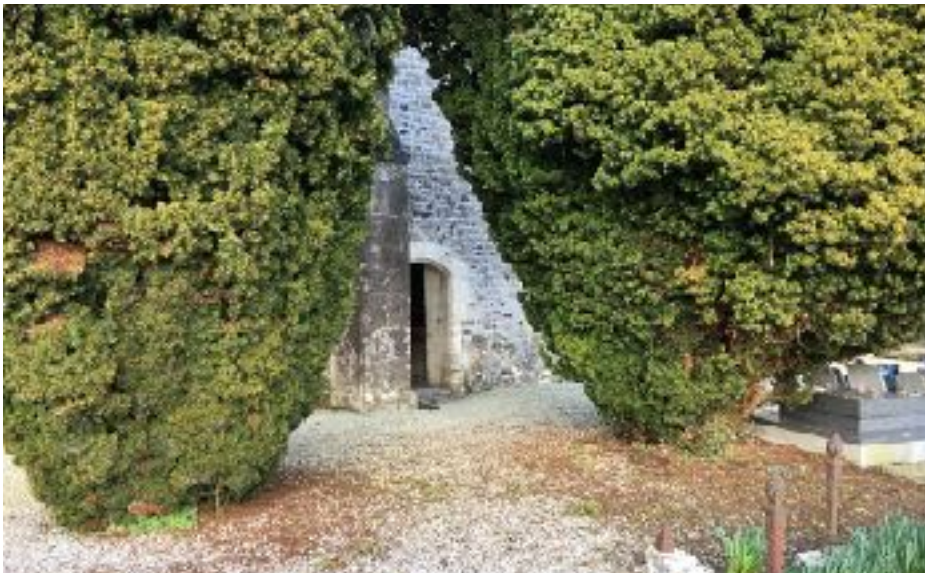
Lien étroit entre la porte méridionale et les ifs fastigiés marquant le passage