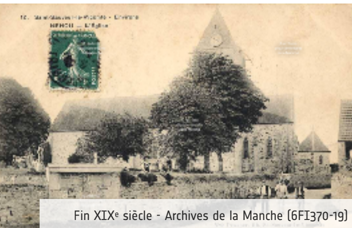
Fin XIX e siècle - Archives de la Manche (6FI370-19)