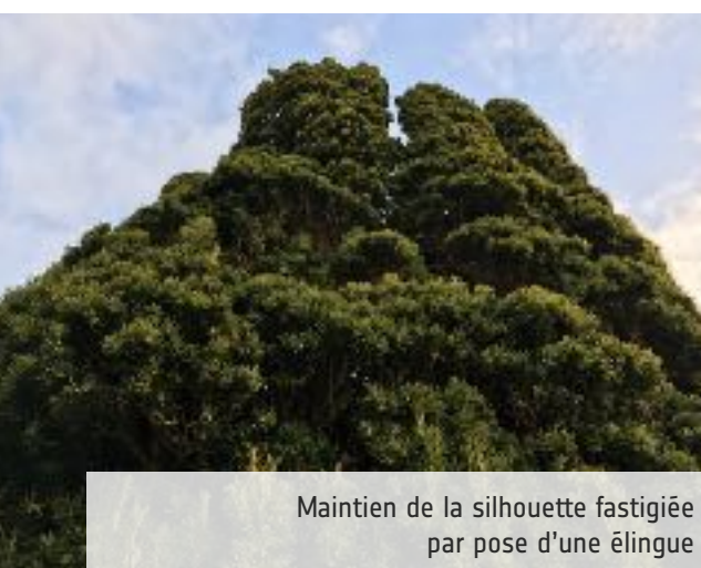
Maintien de la silhouette fastigiée par pose d'une élingue