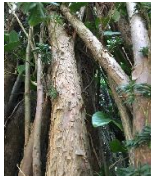
Ramure typique de l'espèce