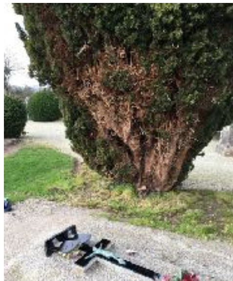
Problématique du pied d'arbre