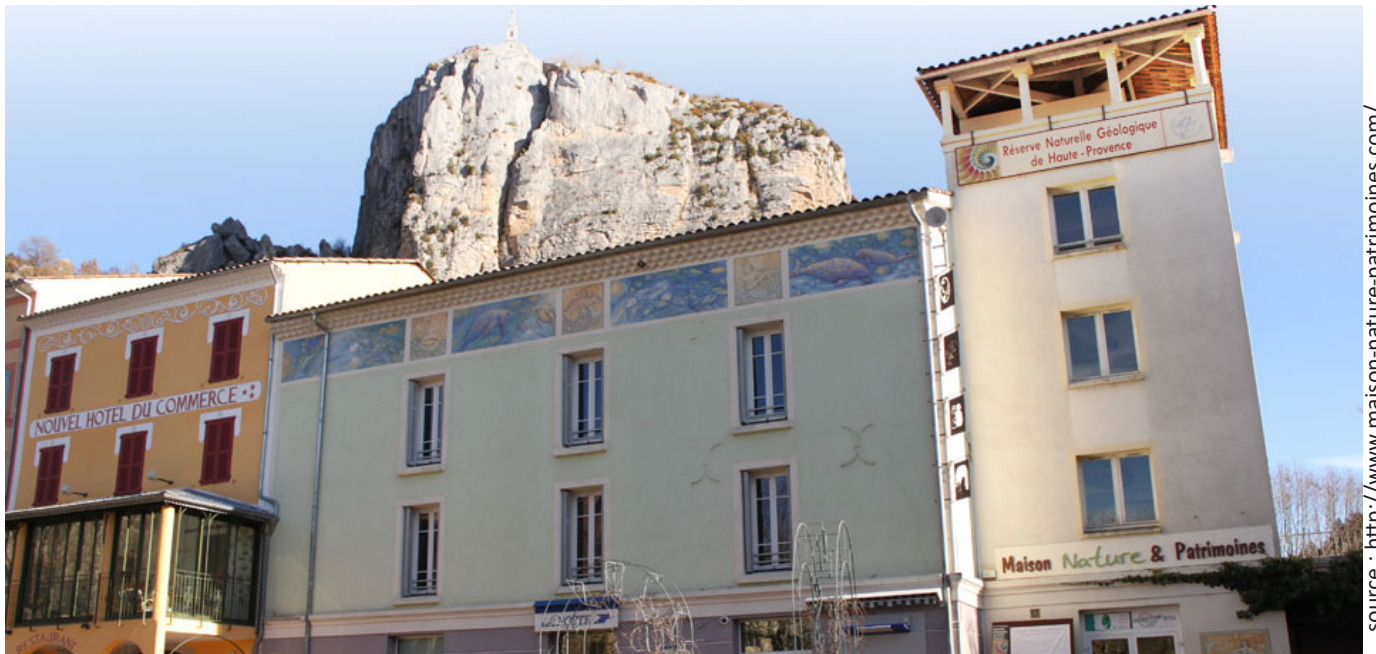
Maison Nature et Patrimoines - Castellane