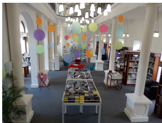
Médiathèque de Saint-Marcelin

Parmi les lauréats du programme de revitalisation des centres-bourgs, plusieurs démarches artistiques ont ainsi été imaginées de manière à intégrer les habitants.