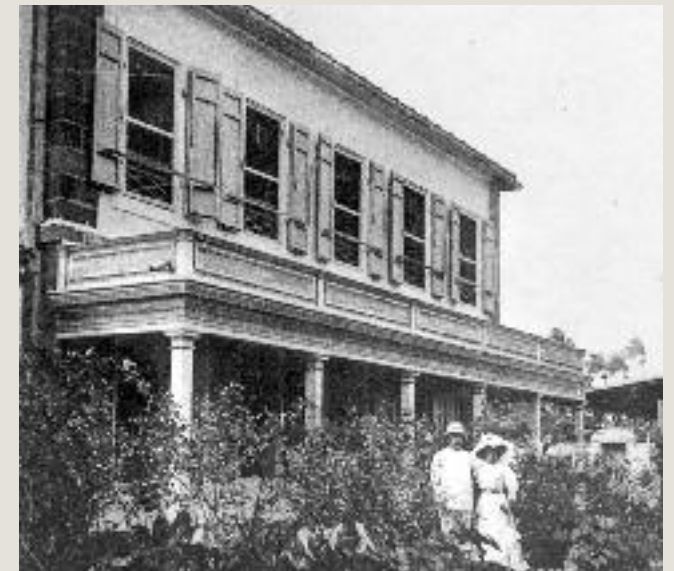
LYCÉE DE LA RÉUNION - MAISON DES PROVISSEURS - DÉBUT DU SIÈCLE

La case Bourbon est propriété de la colonie jusqu'en 1948 puis attribuée à l'État, au ministère de l'Éducation nationale puis au ministère de l'Équipement. En 1991, la gestion en est confiée au Département.