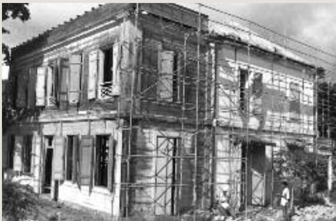
FAÇADE ARRIÈRE - 1981