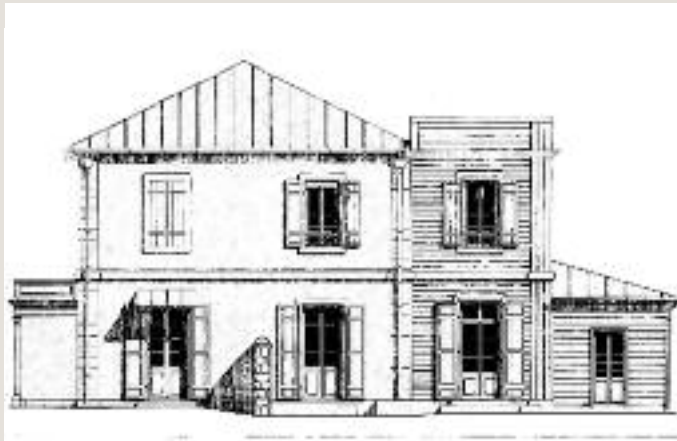
RELEVÉ - FAÇADE EST

L'actuelle façade principale a été modifiée avec la démolition de la varangue extérieure rajoutée en appentis. Une varangue intérieure a été créée dans le style créole à la place de l'ancienne salle à manger de la maison. Des auvents, corniches et lambrequins ont redonné à la case son caractère patrimonial et sa vocation de réception du public a été affirmée par la transformation de la façade nord en façade principale, l'accès se faisant désormais rue Monseigneur de Beaumont.