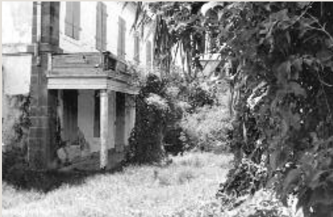
VARANGUE - FAÇADE PRINCIPALE - 1981