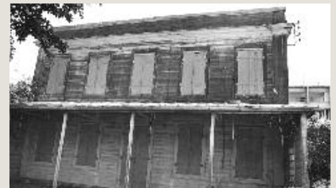
MAISON DES PROVISSEURS - FAÇADE CÔTÉ RUE (ANCIENNE FAÇADE ARRIÈRE) - 1976