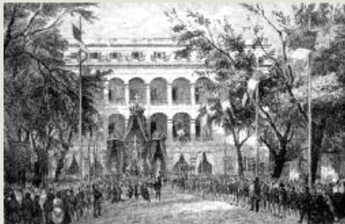
ANTOINE ROUSSIN - LYCÉE IMPÉRIAL - 1859