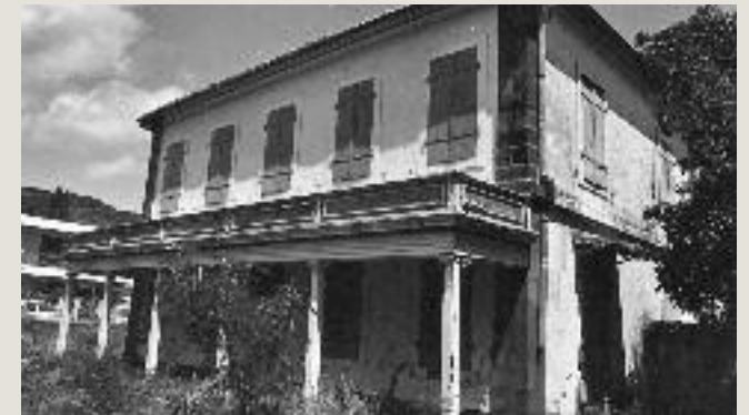
MAISON DES PROVISSEURS - FAÇADE CÔTÉ COLLÈGE (ANCIENNE FAÇADE PRINCIPALE) - 1976