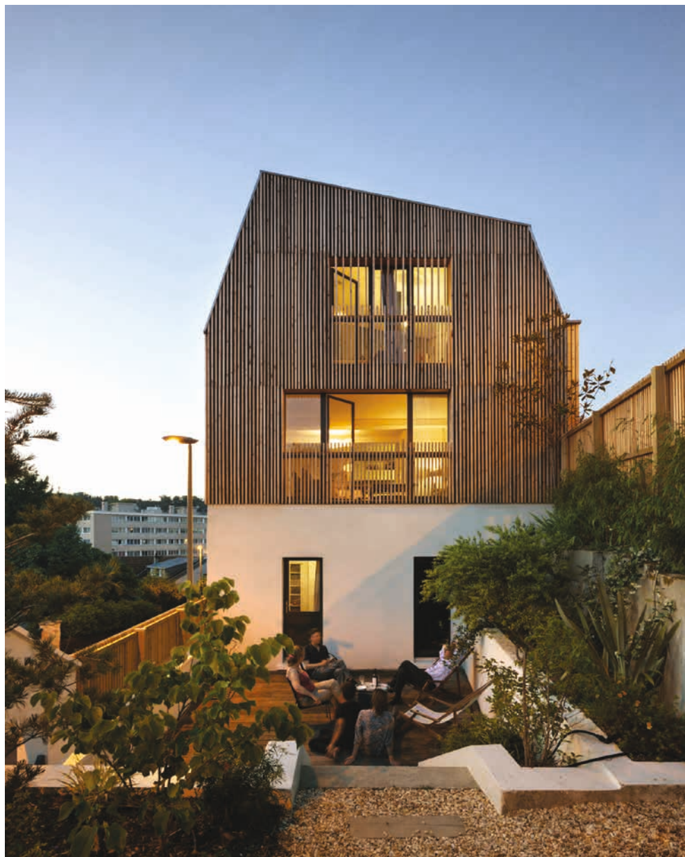
SURÉLÉVATION, SÈVRES (92), 2016 – AGNÈS ET AGNÈS ARCHITECTES © CÉCILE SEPTET.