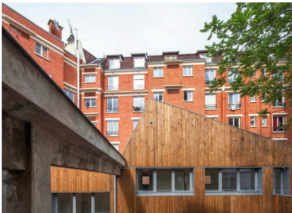
MELROSE SHEDS, PANTIN (93), 2013 - DES CLICS ET DES CALQUES ARCHITECTES

Armelle Erdogan CAUE d'Île-de-France, contact@caue-idf.fr, 01 48 87 71 76