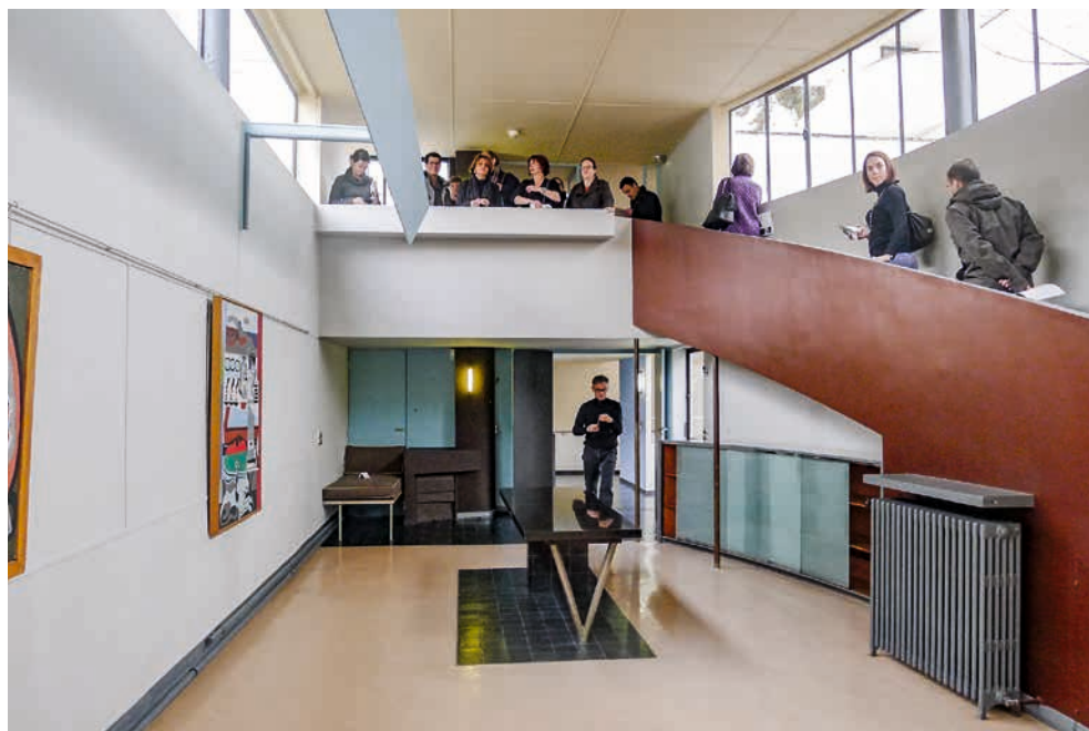
MAISON LA ROCHE-JEANNERET, PARIS, LE CORBUSIER

Au cours de la deuxième journée, un retour sur la construction de masse des grands ensembles et des opérations de promotion immobilière des Trente Glorieuses, dont la qualité est inégale, permettra de faire un bilan des interventions réalisées depuis la fin du XX e siècle pour réparer, compléter, améliorer la vie de ses habitants. Les projets actuels et à venir seront éclairés par ce regard sur les caractéristiques de cet héritage architectural.