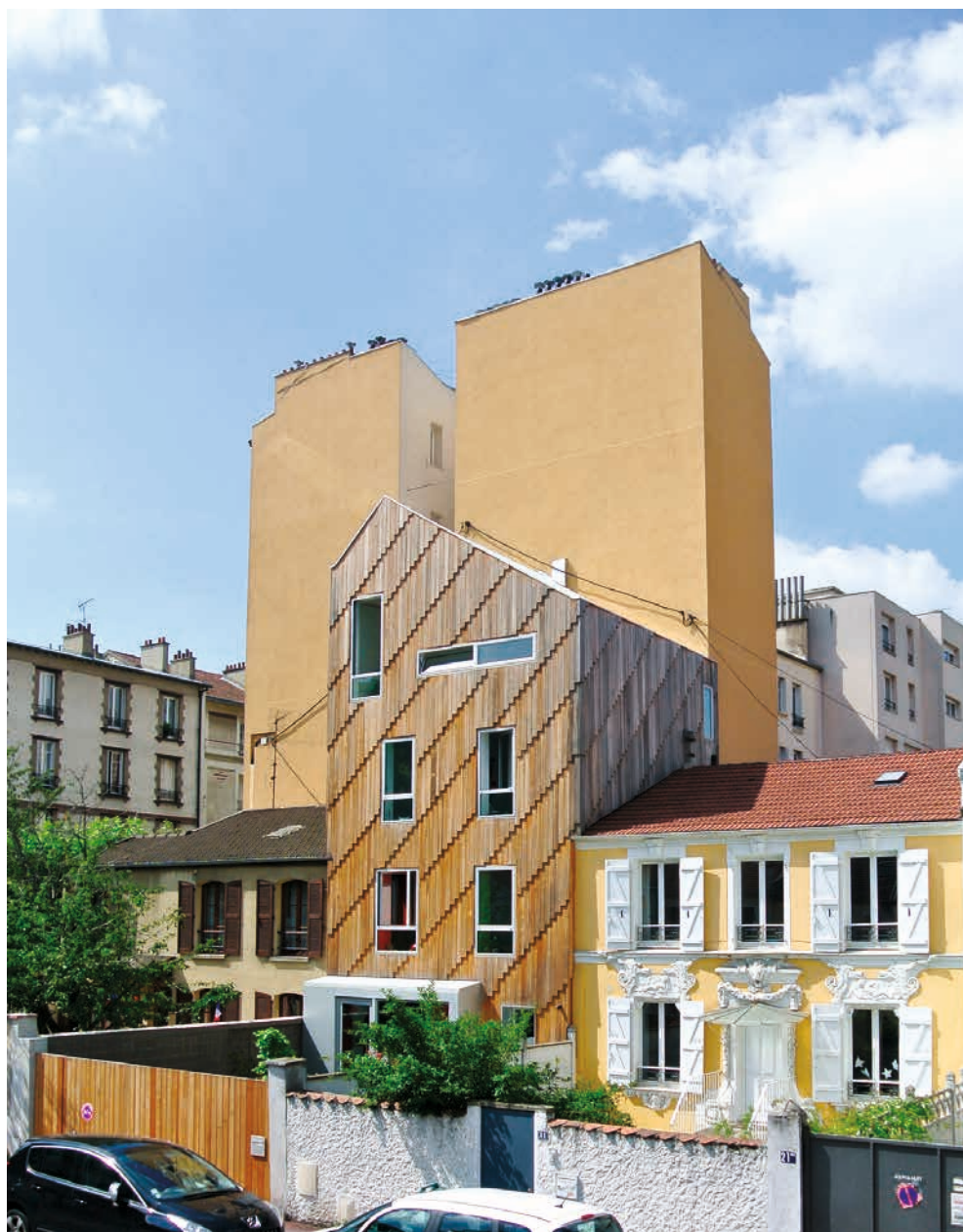
RESTRUCTURATION, EXTENSION D'UN PAVILLON, MALAKOFF (92), 2013 - CROIXMARIEBOURDON ARCHITECTES ASSOCIÉS © CROIXMARIEBOURDON ARCHITECTES ASSOCIÉS.