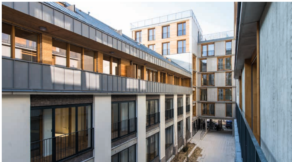
36 LOGEMENTS SOCIAUX EN CONSTRUCTION NEUVE, RÉHABILITATION ET SURÉLÉVATION, PARIS 15, 2015 - FRANÇOIS BRUGEL ARCHITECTES ASSOCIÉS