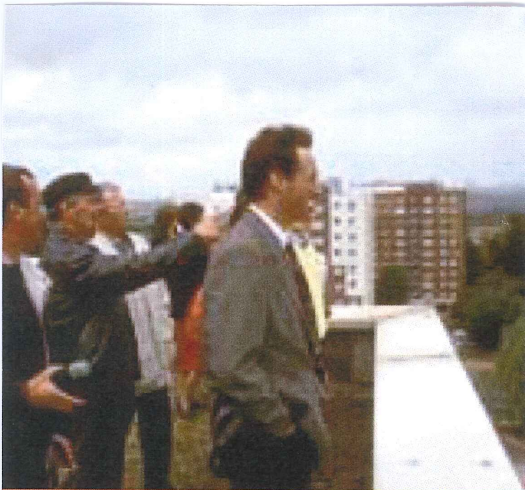
ATU, GRANDE-SYNTHE 1994

Se rassembler et communiquer pour créer une nouvelle, Pour les citoyens.