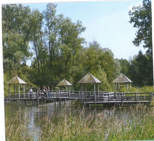
PARC DE LA DEÛLE