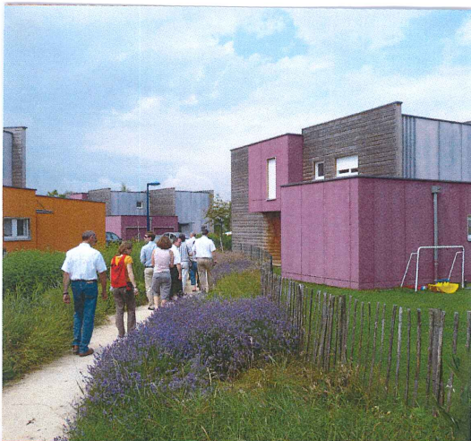
VERS UN URBANISME DE QUALITÉ 2008

Se rassembler et communiquer pour créer une nouvelle, Pour les citoyens.