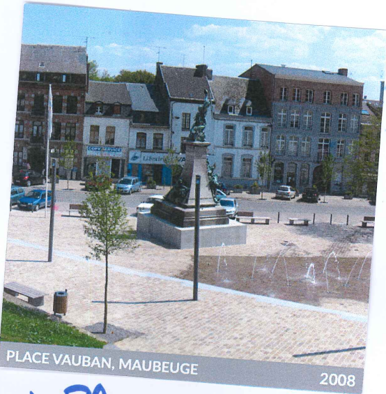
PLACE VAUBAN, MAUBEUGE