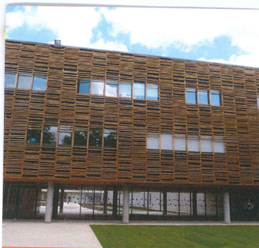
COLLÈGE DE WAZEMMES, LILLE

Pour nourrir et pour aider les familles pauvres