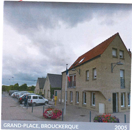
GRAND-PLACE, BROUCKERQUE 2005