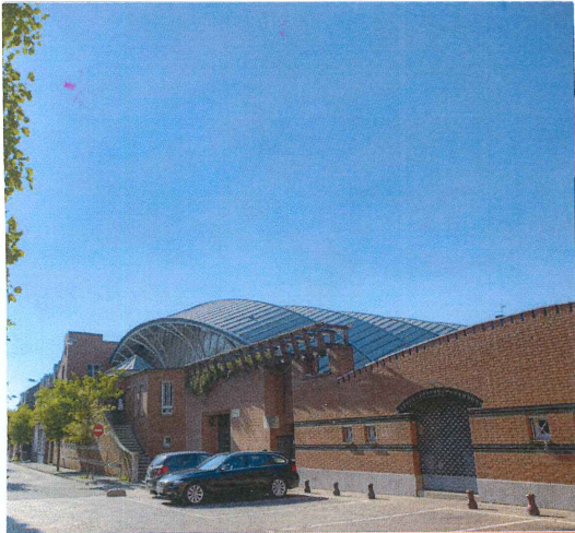
SALLE DE SPORTS, MONS EN BAROEUL 1980