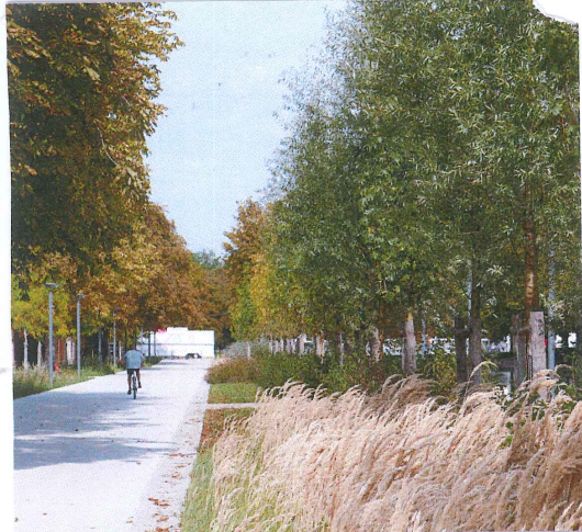
CHAMPS DE MARS, LILLE