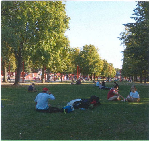
PARC JEAN-BAPTISTE LEBAS, LILLE 2004

Un jardin avec de la végétation (des fleurs, des buissons, des arbres) des Salmiers.... avec des cailloux blanc et fleurs. Banc. Parc de jeux. Un petit parc de jeux pour les enfants.