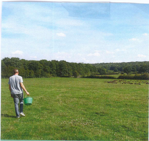
FERME DU BEAU PAYS, MOUSTIER-EN-FAGNE 2011

Pour se rencontrer, de meilleur hygiène car on peut se loger