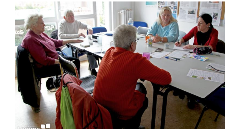
Exemple de la Maison du Projet de Lomme (quartier de la Mitterrie) :

Elle peut aussi être le support de dispositifs de Gestion Sociale et Urbaine de Proximité. Cela inclut une gestion technique du quartier durant le temps des chantiers (éclairage public, collecte des déchets, stationnement, circulation, réserves foncières, etc.), une gestion de proximité (la tranquillité publique, la sécurité, la médiation) et une gestion sociale (insertion par l'emploi, etc.).