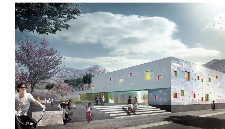
Exemple de la Maison du Projet de Marseille :

La Maison du projet est également le lieu de concertation pour réfléchir à leur conception.