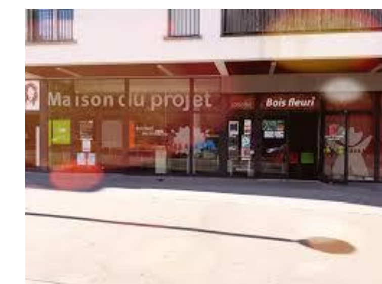
Exemple de la Maison du Projet de Lormont (A proximité de Bordeaux) :

Les promoteurs et bailleurs peuvent apporter leur contribution à la Maison du Projet en y diffusant leurs outils de communication et de promotion (plaquettes, maquettes, affiches...) et en utilisant les lieux comme un lieu de travail (réunions, etc.).