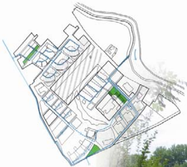
3 lieux pour accumuler l'eau avec les plantes