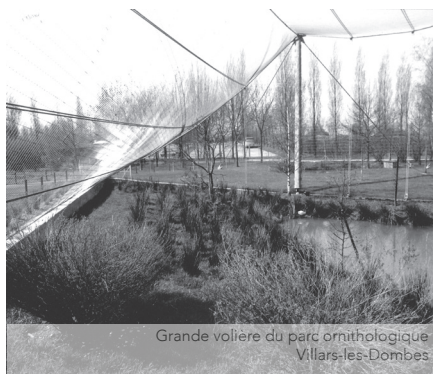
Grande volière du parc ornithologique Villars-les-Dombes

Marc Dosse et Pierre Dosse sont deux architectes qui, successivement mais aussi en tant qu'associés pendant une vingtaine d'années, ont construit bon nombre des bâtiments qui comptent à Bourg-en-Bresse et dans l'Ain, parfois au-delà, lorsqu'ils s'aventurent sur les grands espaces de la société des loisirs pour construire des villages de vacances.