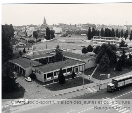
Centre socio-sportif, maison des jeunes et de la culture Bourg-en-Bresse

Site internet « archi 20 21 » présentant les interventions effectuées au XXIe siècle sur des bâtiments construits au cours du XXe siècle