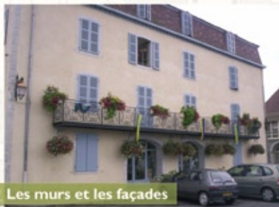
Les murs et les façades

St-Etienne-de-Buglary