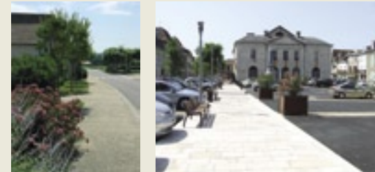
Siros et Navarrenx

la multiplicité des réseaux et de leurs gestionnaires nécessite la mise en place impérative d'une coordination entre les différents acteurs, et ceci assez longtemps à l'avance pour programmer les aménagements avec logique et cohérence. Il faut prévoir trois ans environ pour rechercher les financements, établir le programme, définir le projet de l'ensemble des aménagements et planifier les tranches de travaux.