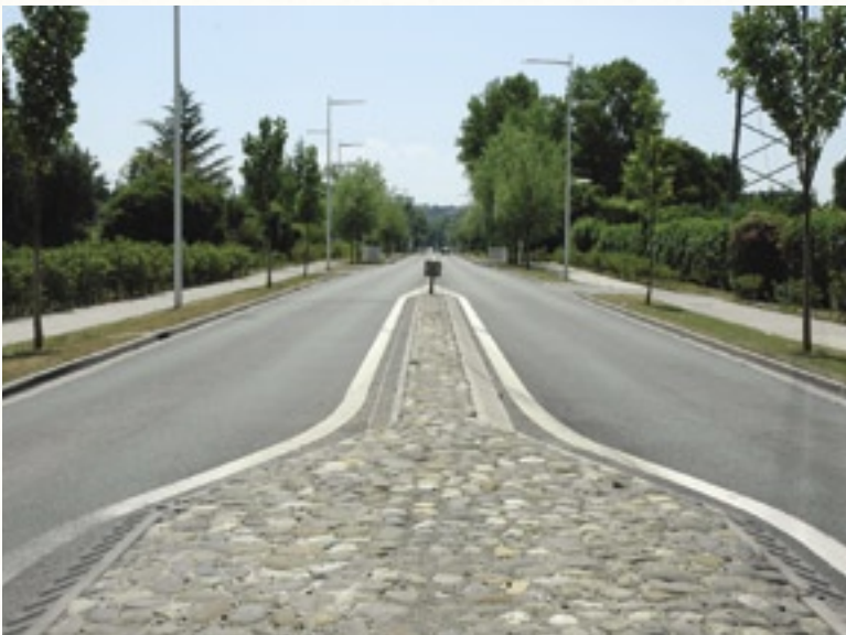
Mourenx - photo P.C. Guiollard

La loi du 29 décembre 1979 sur la publicité fait une distinction entre la publicité, les enseignes et les pré-enseignes :