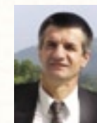
Jean LASSALLE Président du Comité départemental du tourisme Béarn-Pays basque