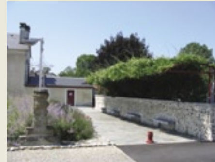
Gélos - photo C.A.U.E. 64