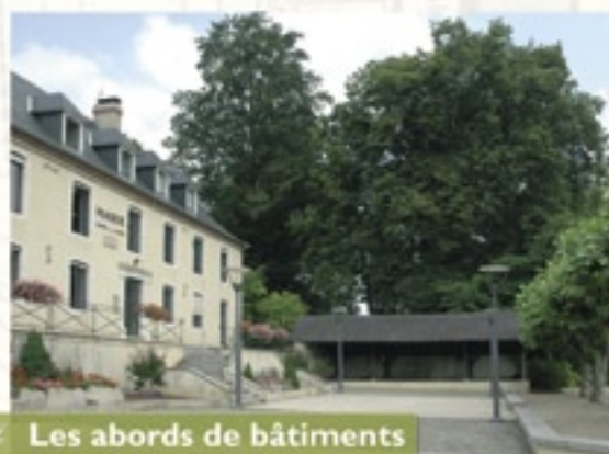
Les abords de bâtiments et monuments publics