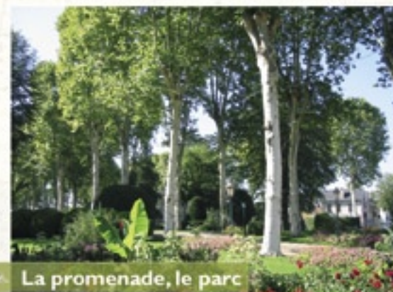
La promenade, le parc et le jardin publics