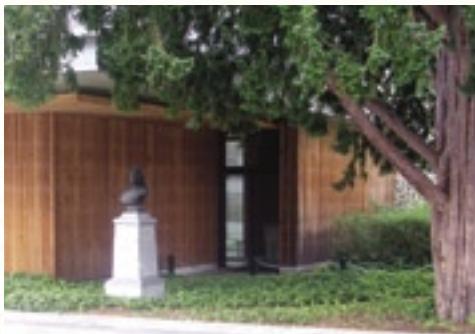
Oloron - photo C.A.U.E. 64

Pour chaque tranche de travaux, il est fondamental de se référer à un seul et même projet d'ensemble, véritable fil conducteur de l'aménagement. Le projet global devient ainsi, avec le temps, le garant de la cohérence du résultat final.