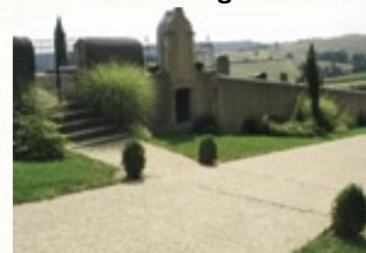
Mascaraàs-Haron - photo C.A.U.E. 64

Les arbres, les arbustes, les buissons, les massifs et les tapis herbeux sont des outils précieux pour structurer et modeler ces espaces, nouveaux ou traditionnels.