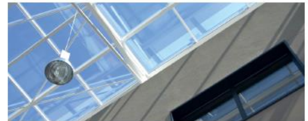
Une association qui PRÉPARE L'AVENIR