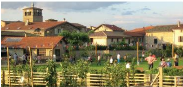
Une association qui PARTAGE