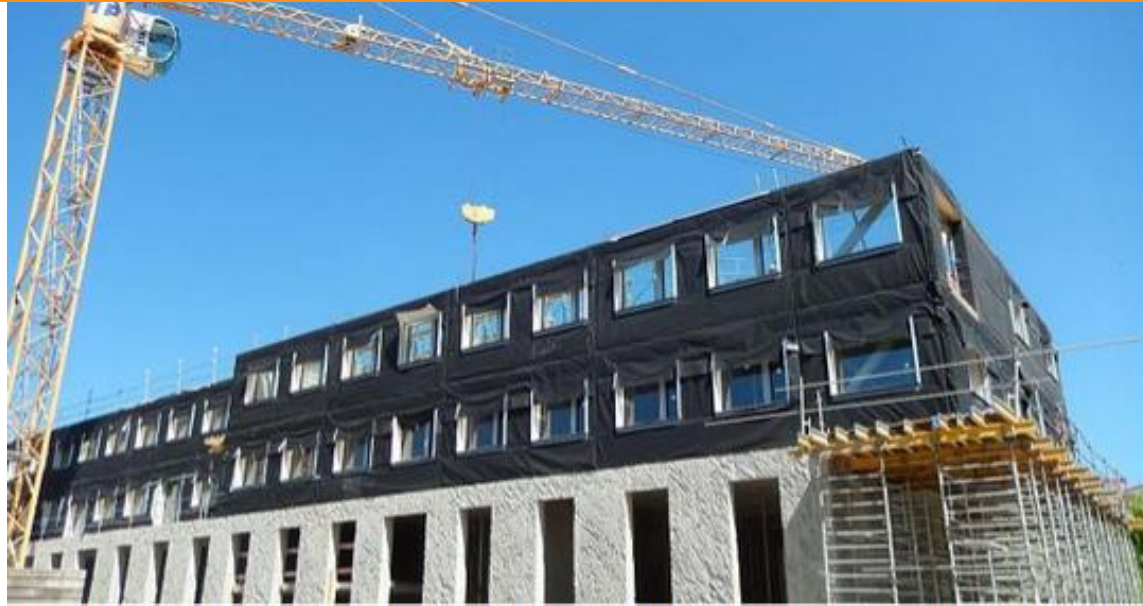
Crédit photo : Siège Barel et Pelletier SAS PEPEL Antoine BARBEYER Architectes (retenu dans le cadre de l'AP OBEC)