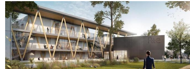
Campus RTE à Jonage (AIA Architectes) – niveau E3C1 visé