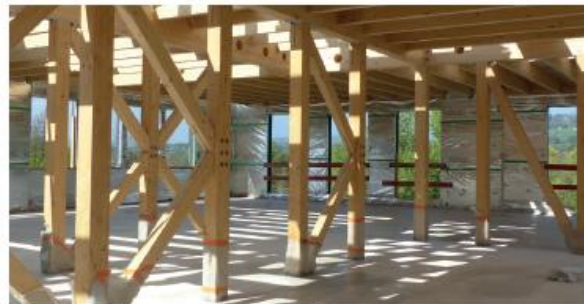
Une association qui INNOVE