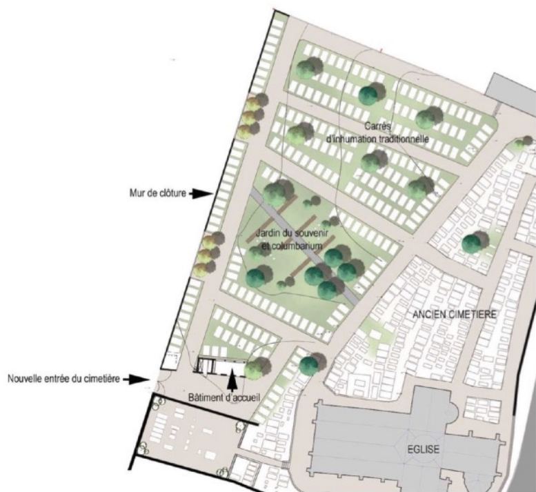
Plan réalisé par l'équipe de maîtrise d'oeuvre