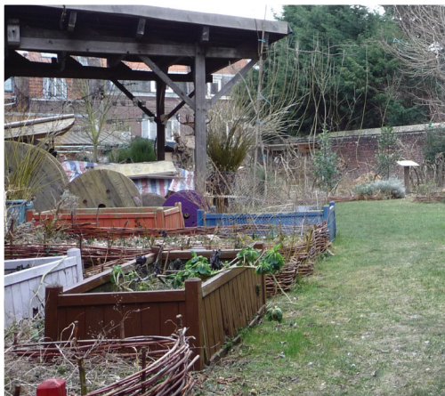
Potager en carrés