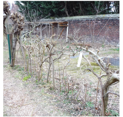
Haie de saule plessé