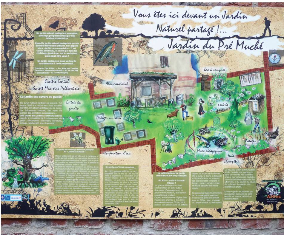
Plan du jardin