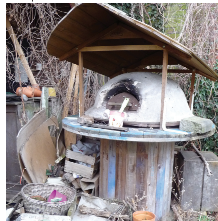
Four à pain

Cet organisme n'a pas de contrat ni d'obligation avec la ville. Ils ont seulement la charte des AJONC à respecter. Celle-ci est commune à tous les jardins du réseau.