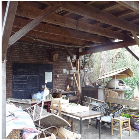
Abri - espace de convivialité