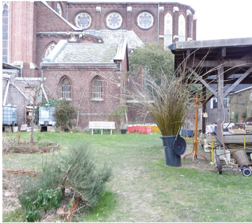
Réserve de tiges de saule pour le plessage