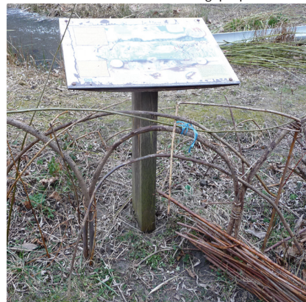
Clôture de saule vivant guidé et panneau pédagogique pour la mare

Le centre-social intervient aussi en apportant sa touche dans le jardin et sert de lieu de réunion par mauvais temps. Dès le début, une solidarité très forte entre tous ces membres était présente et a permis l'élaboration du projet, ainsi que son fonctionnement aujourd'hui.