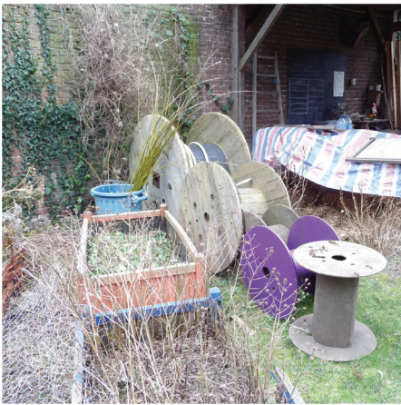
Bobines de câbles servant de tables extérieures