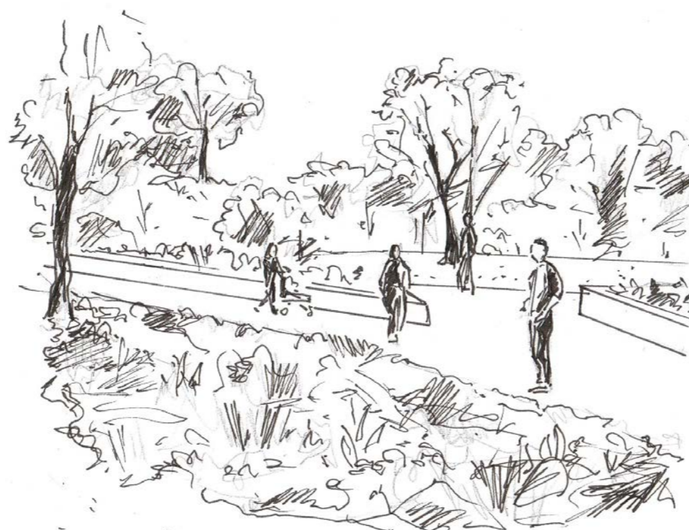
Croisement: chemin, place et verdure