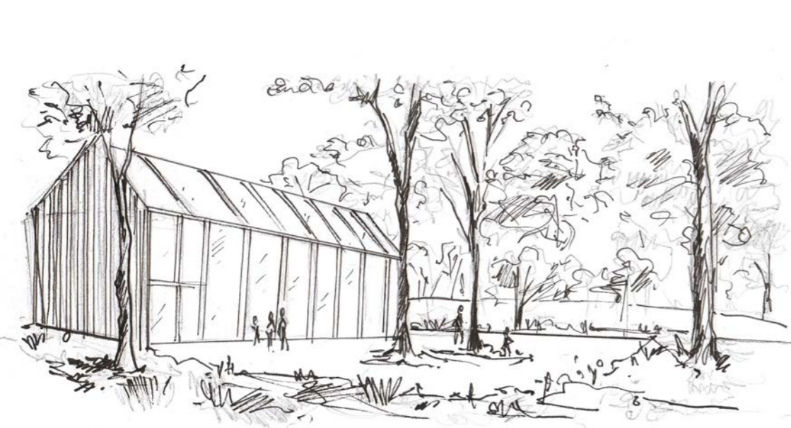
Place de la ressourcerie