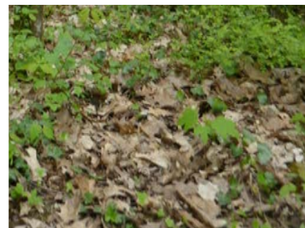
Sol forestier : taillis sous futaie