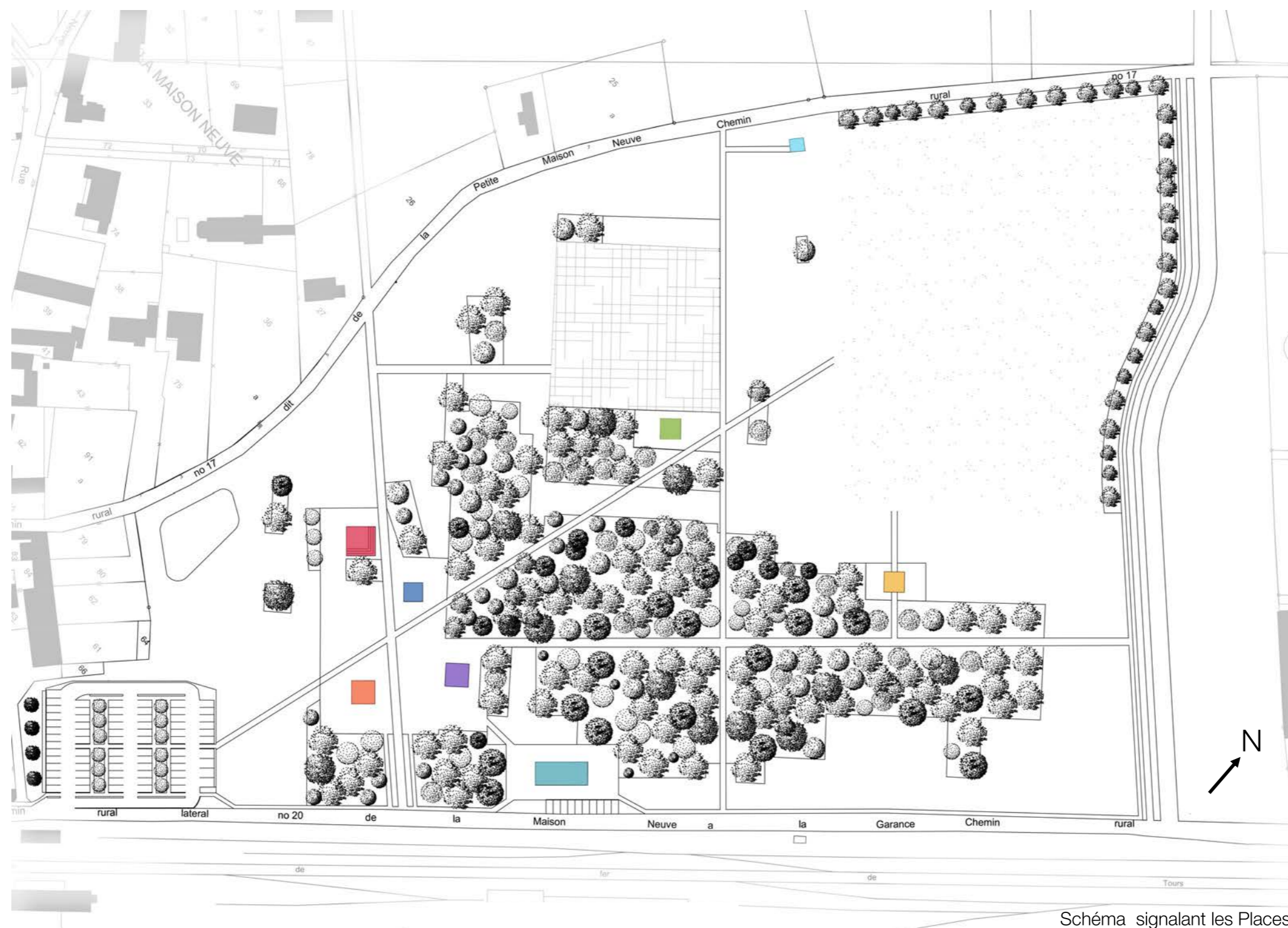
Schéma signalant les Places

Le projet Les places de Meung vise à redynamiser le site de La Fonderie et à créer du lien entre les usagers. L'espace est pensé en vue d'une expansion urbaine qui mettra en avant les notions de rencontre et de partage s'appuyant sur des activités associatives.