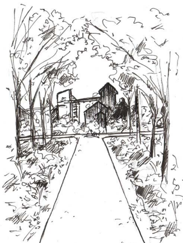
Grand axe vue nord-est

sensibiliser les habitants aux défis environnementaux un espace en jachère est consacré à l'apiculture. Ces lieux de convivialité créent un lien intergénérationnel par le biais d'animations ludiques sur des thèmes très variés. L'environnement évolue selon les saisons et la diversité des zones engazonnées, du taillis sous futaie et des prairies créent un écosystème qui permet l'appropriation du site.