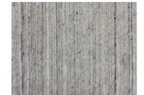
Béton brossé : allées