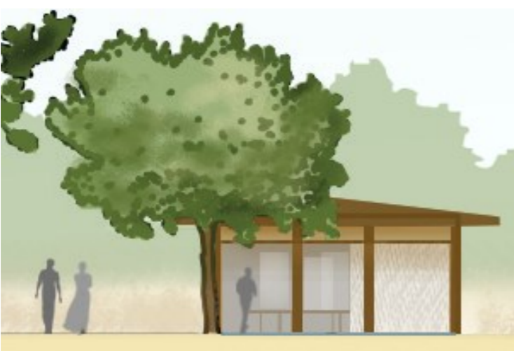
Traitement des sols et des places