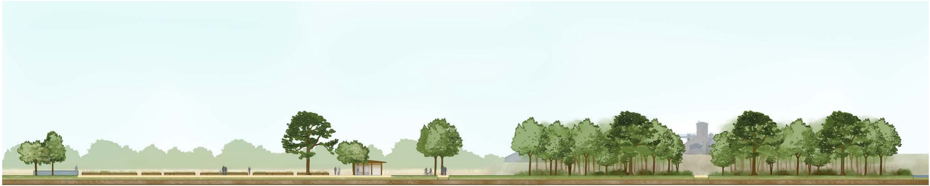
Coupe à l'échelle 1/500 ème , axe est-ouest orienté Nord, vue sur le jardin partagé et l'allée diagonale