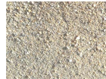
Gravier de Loire : places