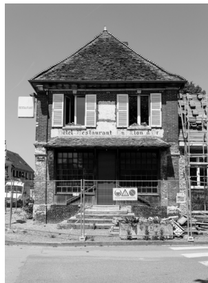
Pendant les travaux