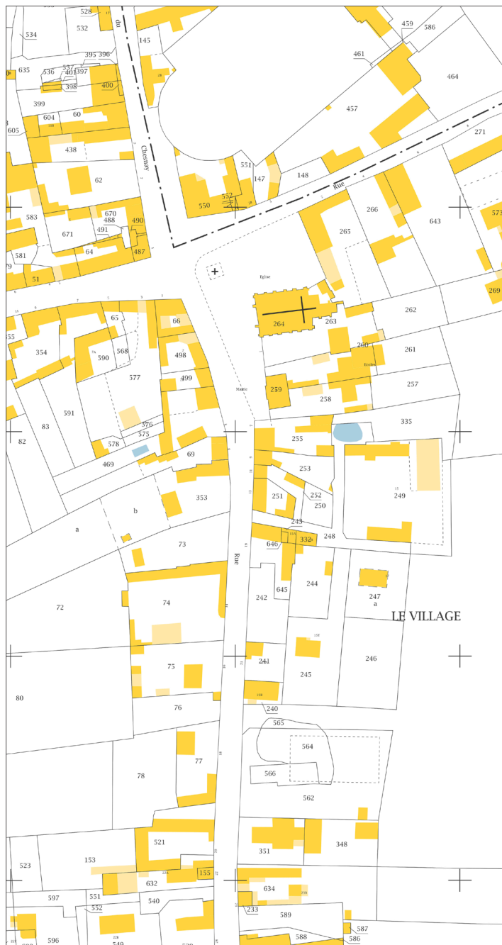
PLAN CADASTRAL DU CENTRE-BOURG (2018)

SE REPERER : Retrouver sur les 3 documents : 1. MON ECOLE - 2. LA MAIRIE - 3. L'EGLISE - 4. LE RESTAURANT 'LE LION D'OR' - 5. LA HALLE COUVERTE