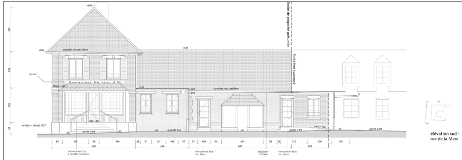
Le dessin : L'élévation © MWAH agence d'architecture