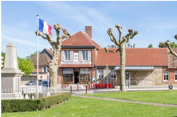
et aujourd'hui, le restaurant est ouvert © MWAH agence d'architecture