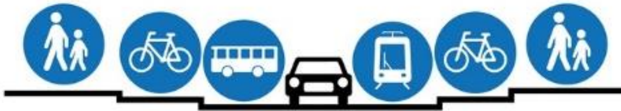
How cities should be designed