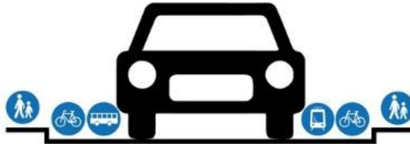
How most traffic engineers see your city