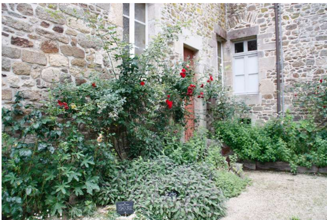
Pied de mur végétalisé