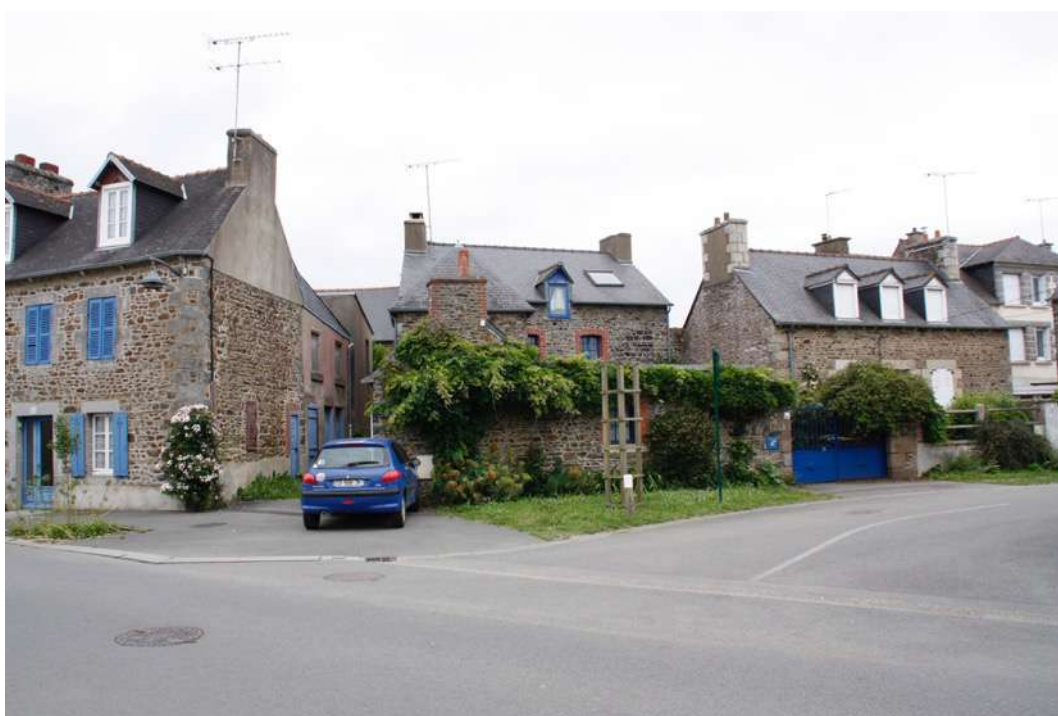
Traitement d'un carrefour