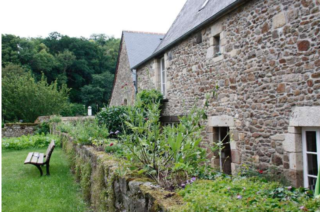
Mur végétalisé (mur « jardinière » )