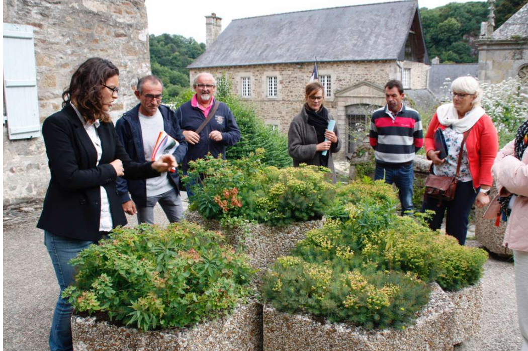
Réemploi de bacs