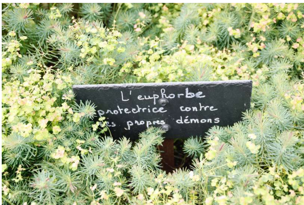
Étiquetage des plantes dans les jardins et les massifs dans les rues