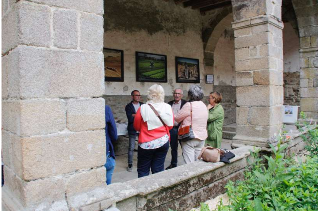
Cloître de l'abbaye Saint Magloire lieu d'accueil et d'exposition jardin thématique