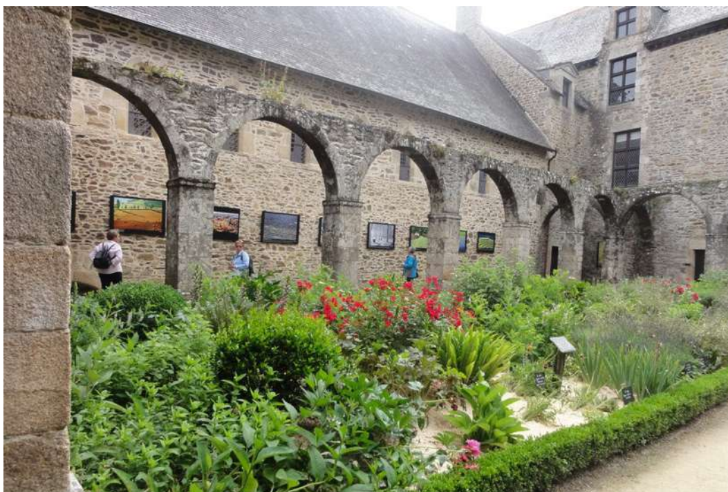
Jardin du cloître de l'abbaye Saint Magloire