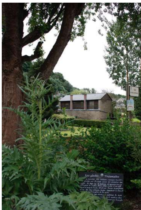
Massif thématique plantes tinctoriales en avant-plan d'un moulin