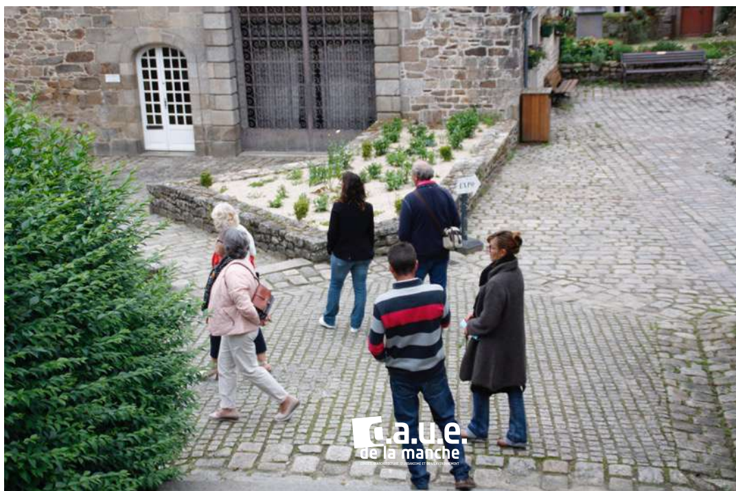
Parvis de la mairie