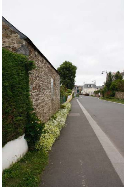
Ourlet végétal en pied de mur