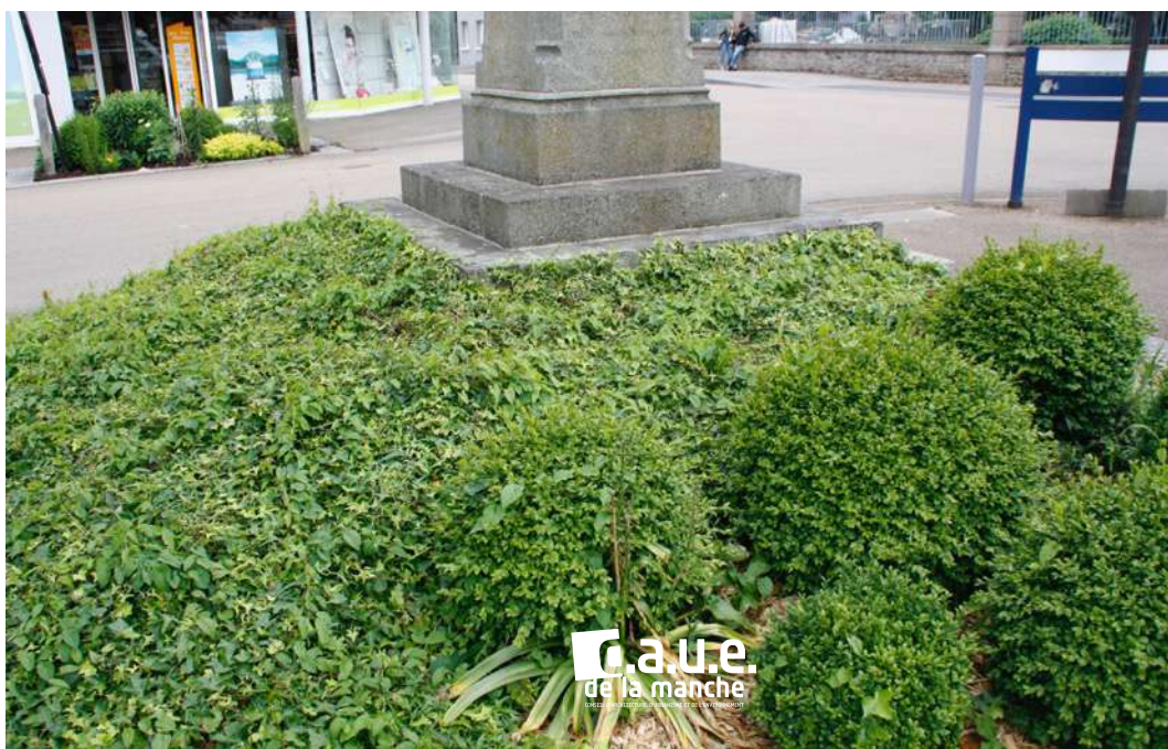
Problématique de mode cultural et d'entretien