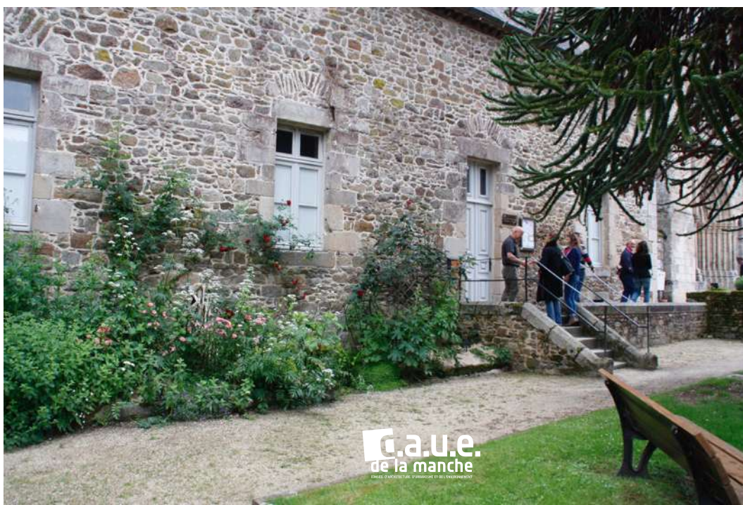
Valorisation du patrimoine bâti