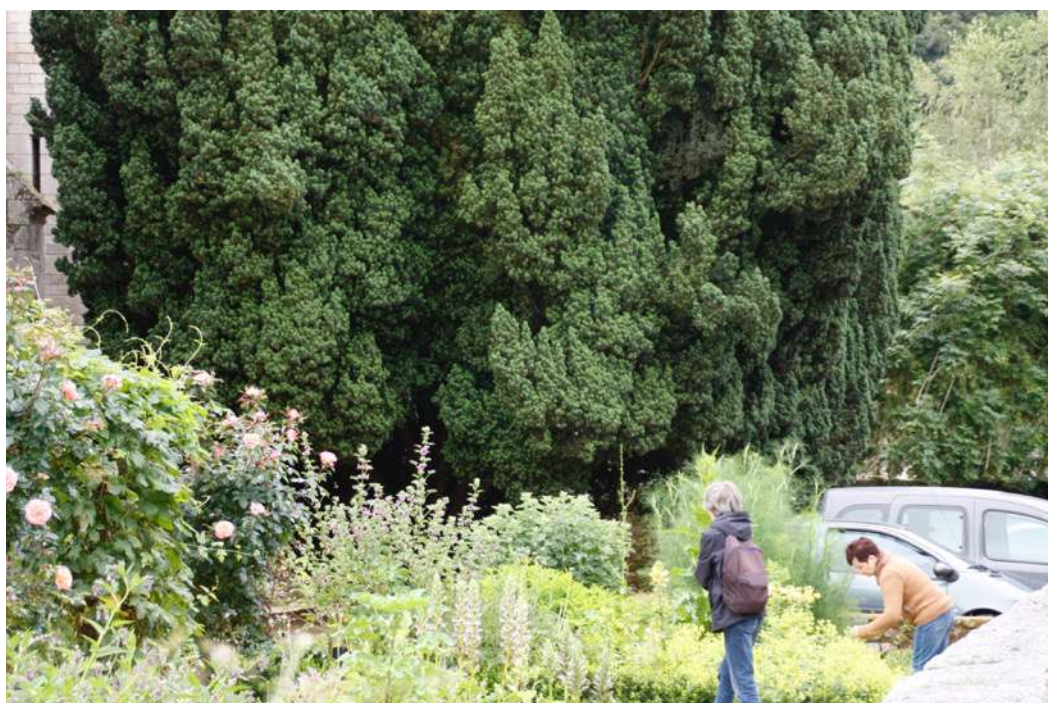
Découverte des simples par les visiteurs