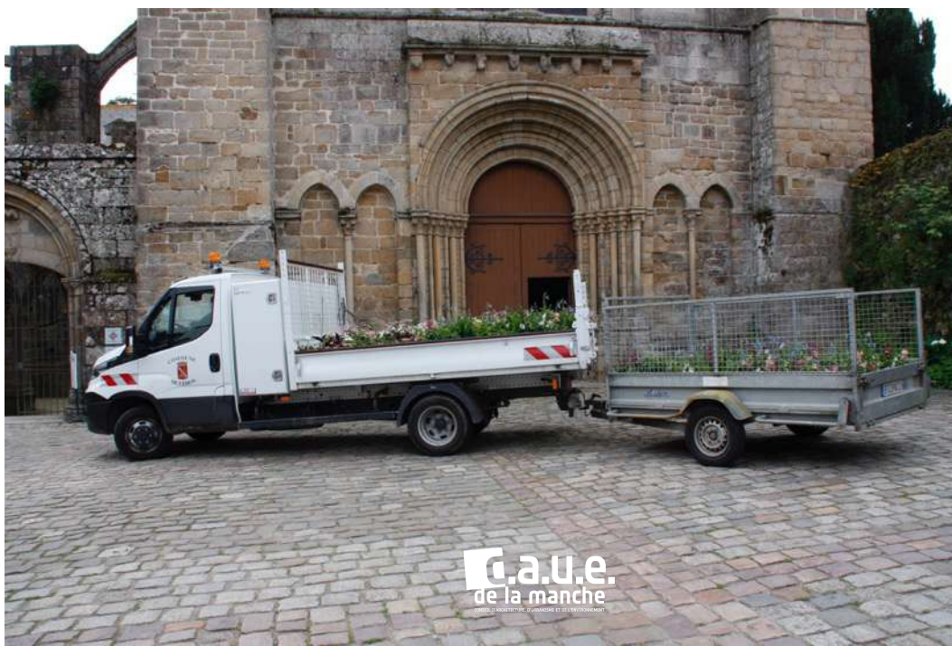
Installation des annuelles le jour de la visite