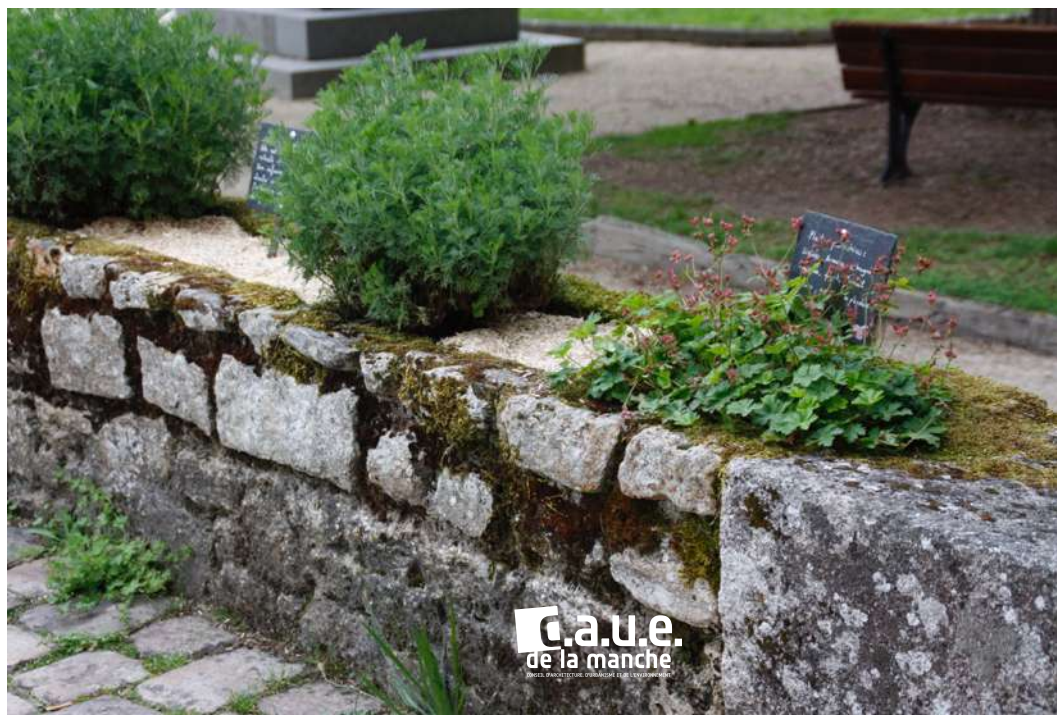
Mur végétalisé (mur « jardinière » )