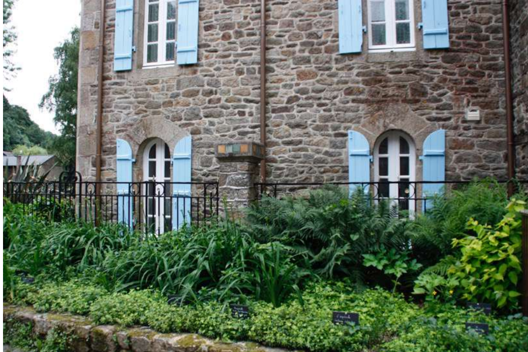
Clôture jardinée d'une maison