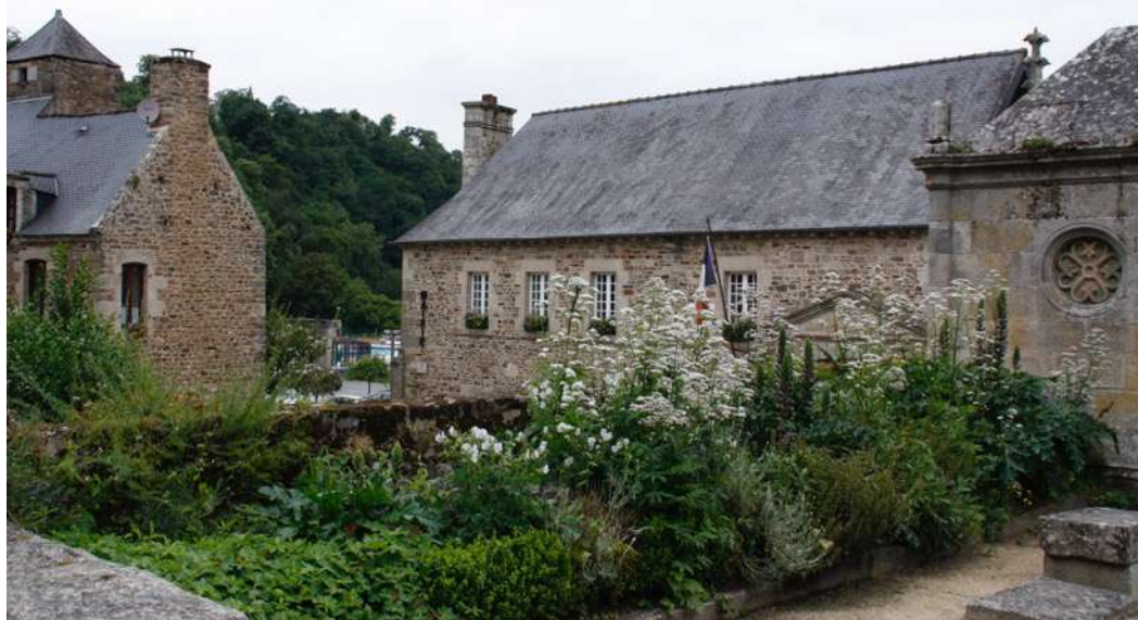
Jardin des pèlerins, mairie en arrière- plan