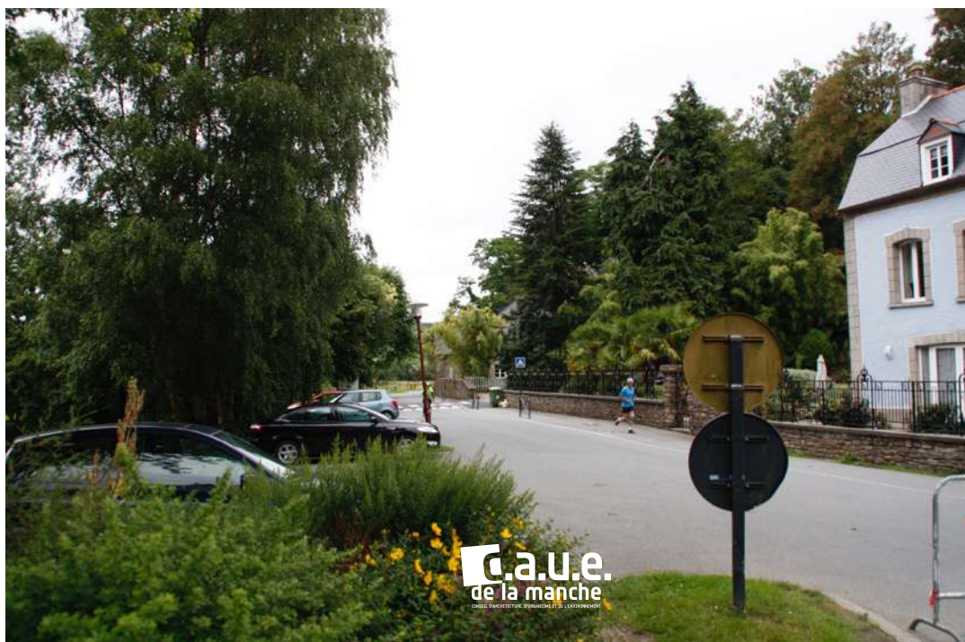
Entrée de ville parking