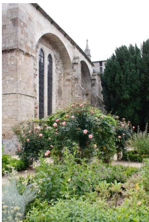
Jardin thématique (jardin des pèlerins)