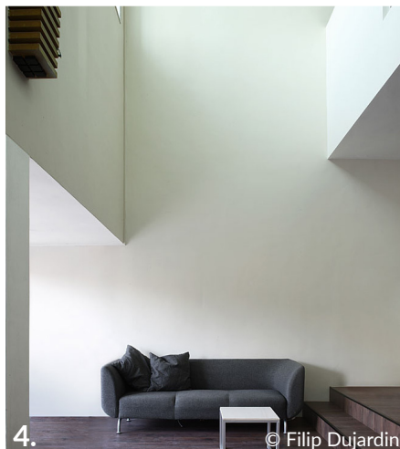
4. © Filip Dujardin