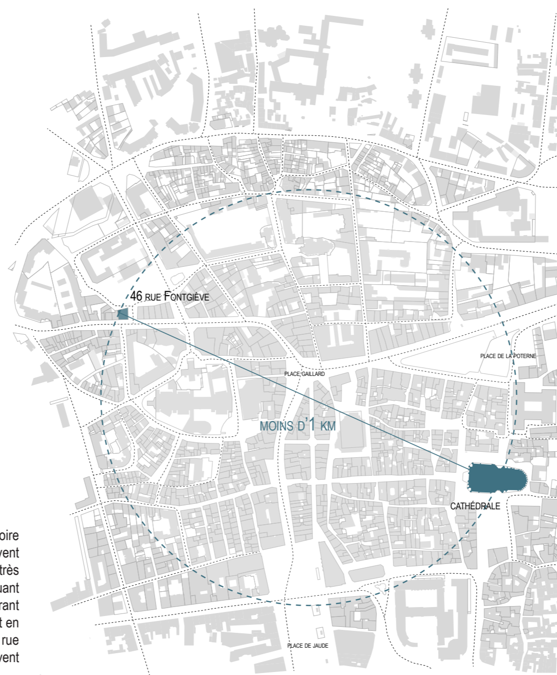
Situation géographique et parcours du réemploi