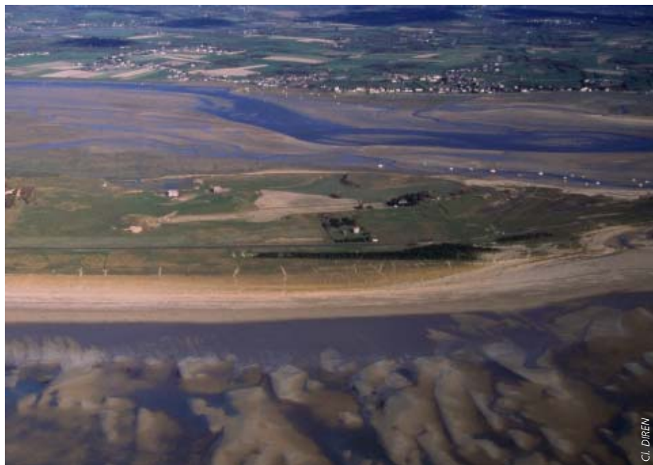
Havre de Régneville

Z one de contact entre la mer, la rivière et le bocage, le havre de la Sienne constitue à la fois une zone d'hivernage, d'escale migratoire, de reproduction et d'estivage pour de nombreuses espèces d'oiseaux qui y trouvent les espaces nécessaires à leur sécurité et à leur alimentation.