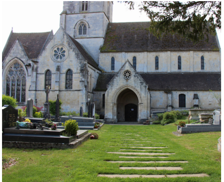
Un chemin de dalles.

Le parvis de l'église est ouvert et dégagé sur la rue St-Martin.