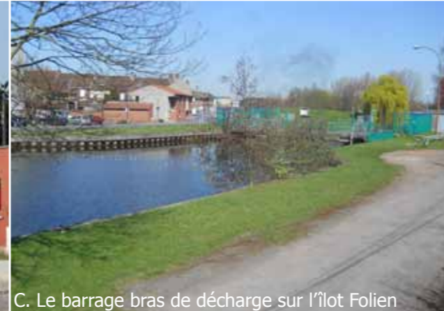
C. Le barrage bras de décharge sur l'îlot Folien