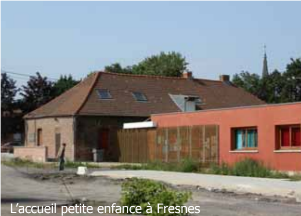
L'accueil petite enfance à Fresnes