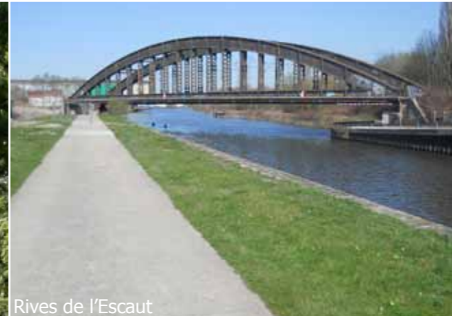
Rives de l'Escaut