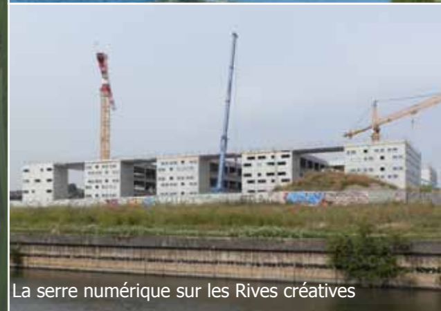
La serre numérique sur les Rives créatives