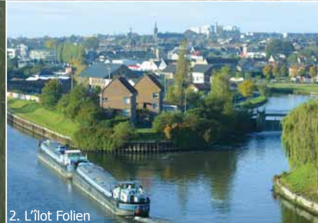
2. L'îlot Folien