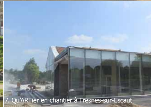
7. Qu'ARTier en chantier à Fresnes-sur-Escaut