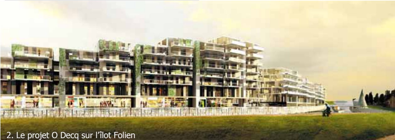
2. Le projet O Decq sur l'îlot Folien

La troisième traverse valenciennoise propose d'explorer L'Escaut de Valenciennes à Fresnes, à travers 3 axes de découverte que sont l'Escaut urbain, économique et naturel. Ils sont représentatifs de l'identité actuelle et passée de ce territoire à travers les marques et indices des grandes réussites humaines successives, liées à l'exploitation intelligente de son système géographique et physique. Ils démontrent aussi la capacité de ce système à produire sa propre reconquête naturelle et écologique face à l'activité anthropique, valeur de biodiversité qui pose aujourd'hui questions sur son rôle de régulateur d'aménités et de nature sur l'ensemble du territoire valenciennois. Les 4 sites de visite choisis illustrent de façon très contrastée les formes que peuvent prendre aujourd'hui les mutations de l'Escaut, ils sont support de projets innovants ou d'un réel potentiel d'aménagement et questionnent les choix de vocations et enjeux croisés qu'ils sont destinés à assumer pour servir pleinement le développement durable du valenciennois.