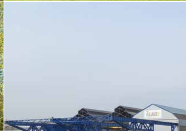
2. Unité navigation sur l'îlot Folien