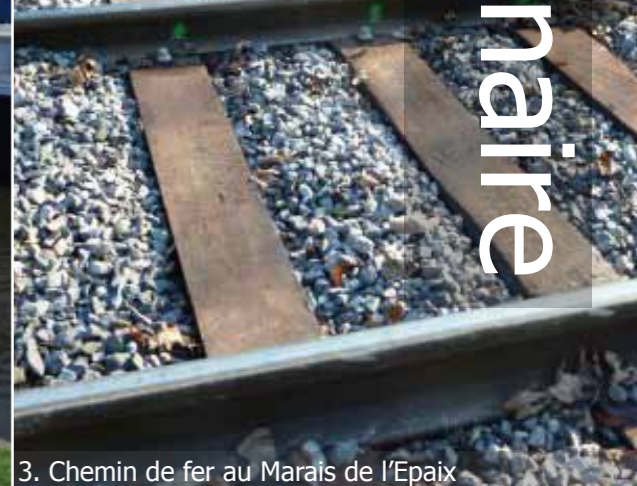
3. Chemin de fer au Marais de l'Epaix