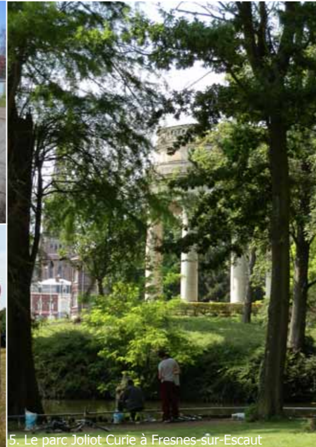
5. Le parc Joliot Curie à Fresnes-sur-Escaut