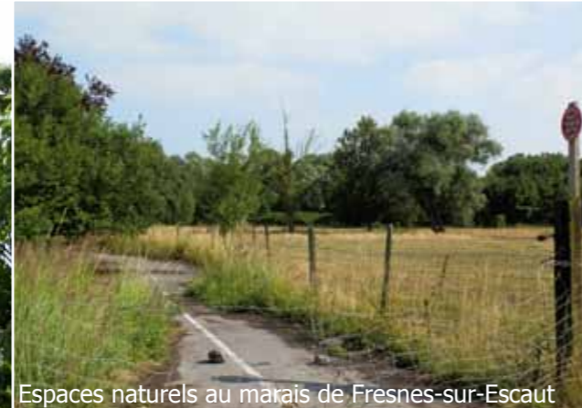
Espaces naturels au marais de Fresnes-sur-Escaut