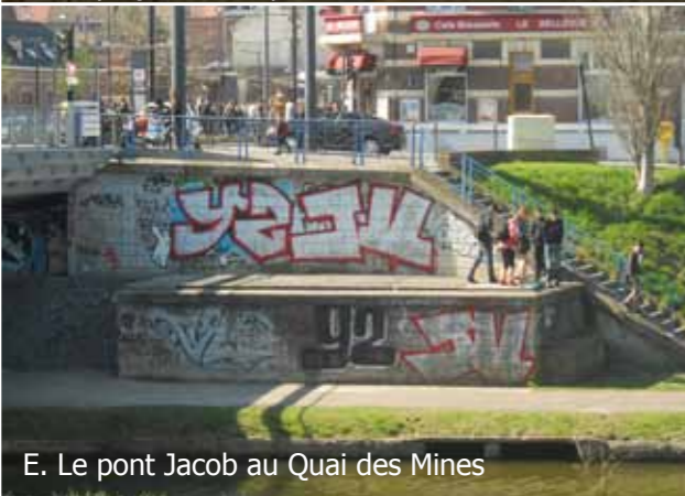
E. Le pont Jacob au Quai des Mines