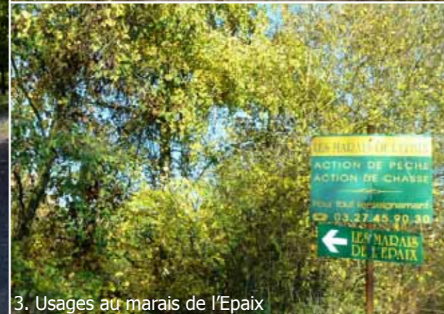
3. Usages au marais de l'Epaix