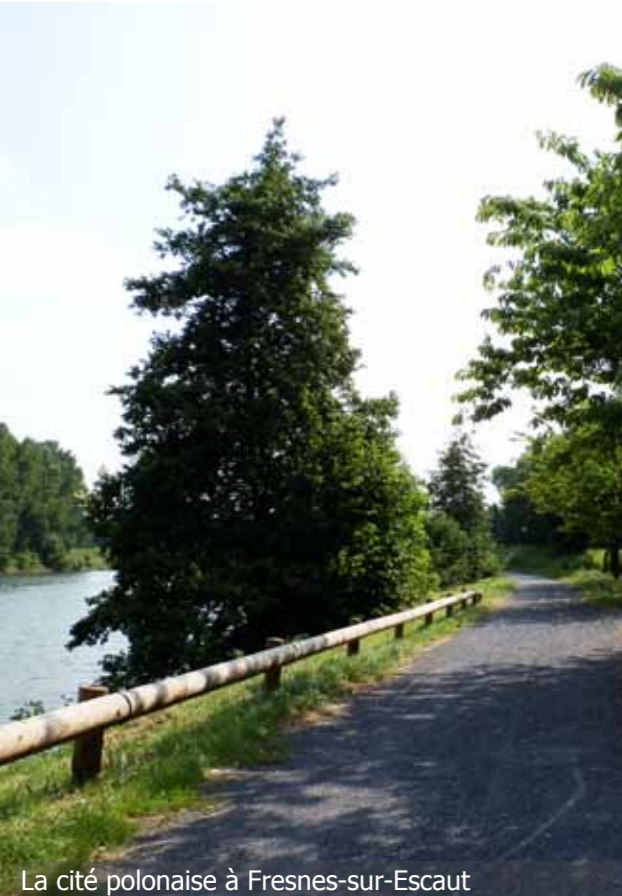
La cité polonaise à Fresnes-sur-Escaut