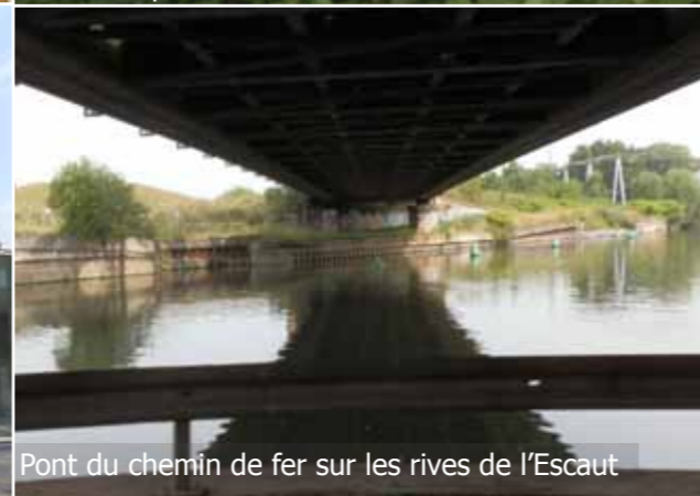
Pont du chemin de fer sur les rives de l'Escaut