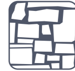
maçonnerie en pierre et briques