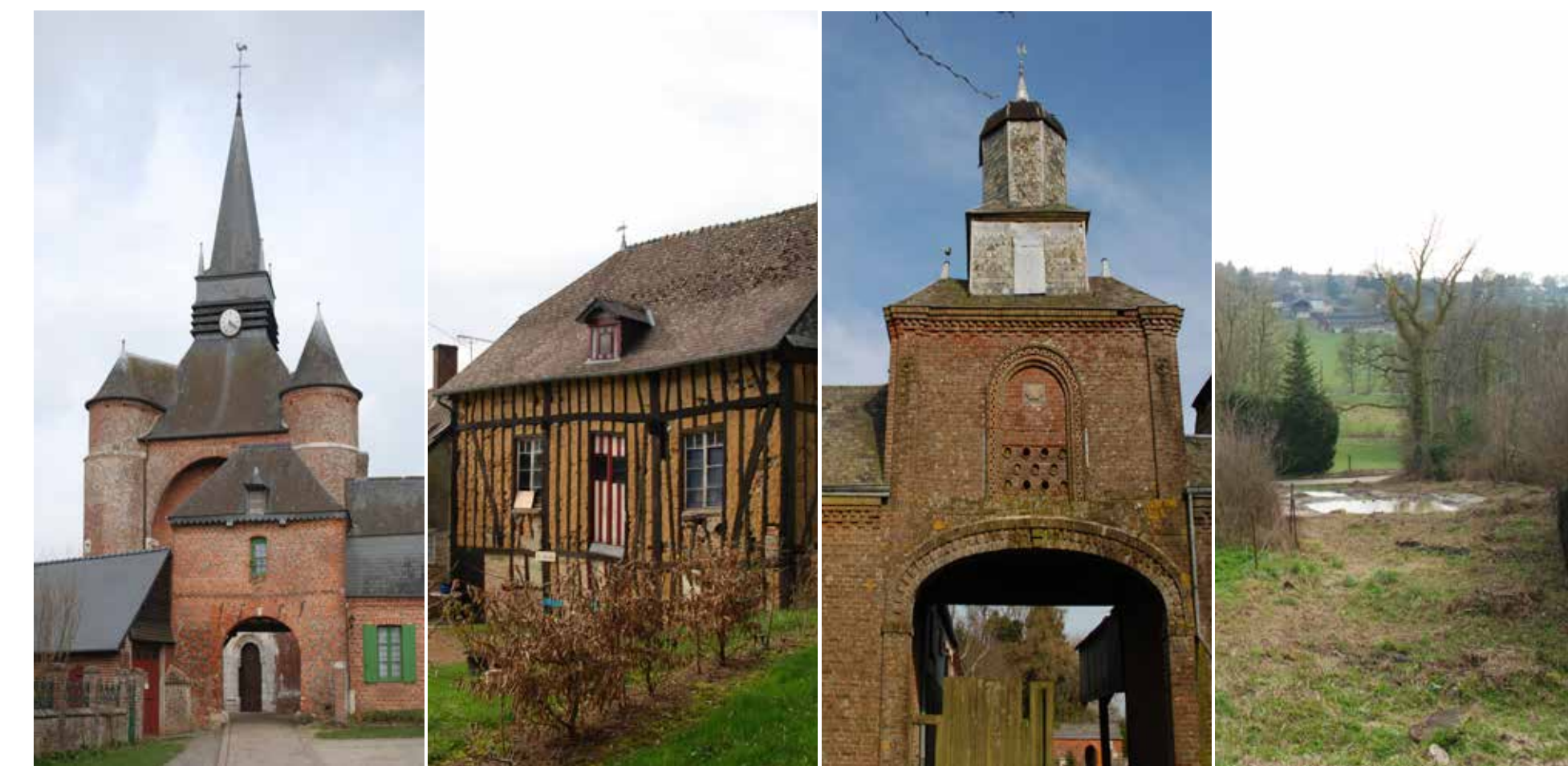
Eglise Saint-Médard Ancien moulin à eau Pigeonnier de la ferme des Froidmants Mares en terrasses