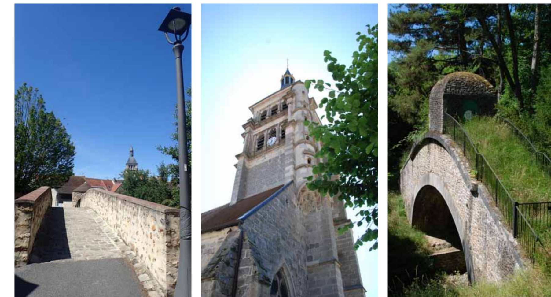
Le pont Auger