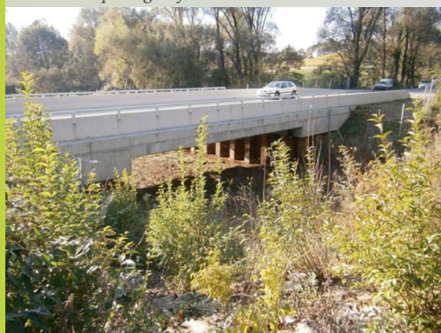
Passage à faune créé à Chignin