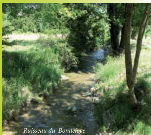
Ruisseau du Bondeloge

Ci-dessus : zones humides et ruisseau concernés par des actions de renaturation