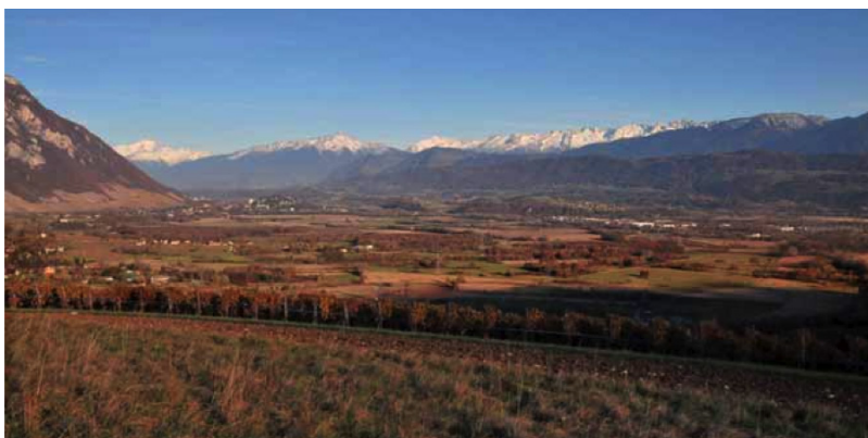
Corridor Chartreuse Belledonne

La Région capitalise les expériences menées par une mise à jour du guide méthodologique des contrats verts et bleus et par l'organisation d'un réseau d'animateurs de ces nouveaux types de contrats, qui prennent la suite des contrats corridors.