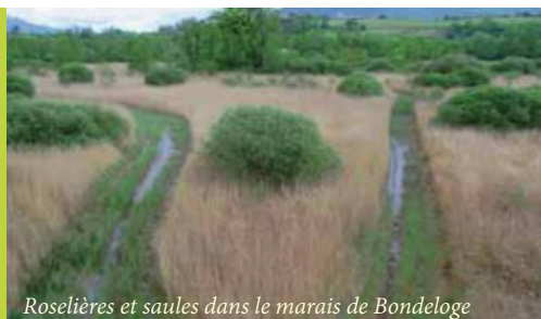
Roselières et saules dans le marais de Bondeloge