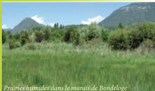
Prairies humides dans le marais de Bondeloge