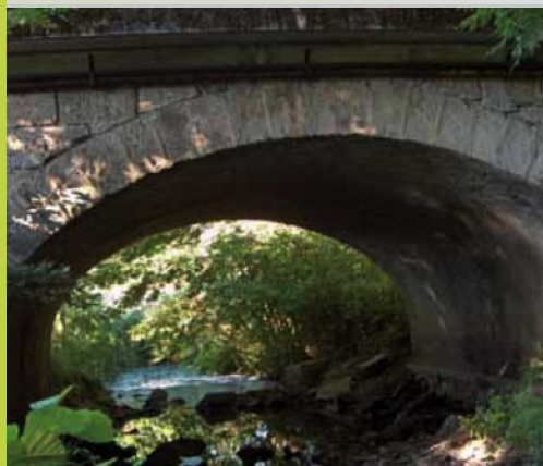
Pont des Mollettes sur le Coisetan avant l'aménagement d'un passage à faune

Ci-dessus : zones humides et ruisseau concernés par des actions de renaturation