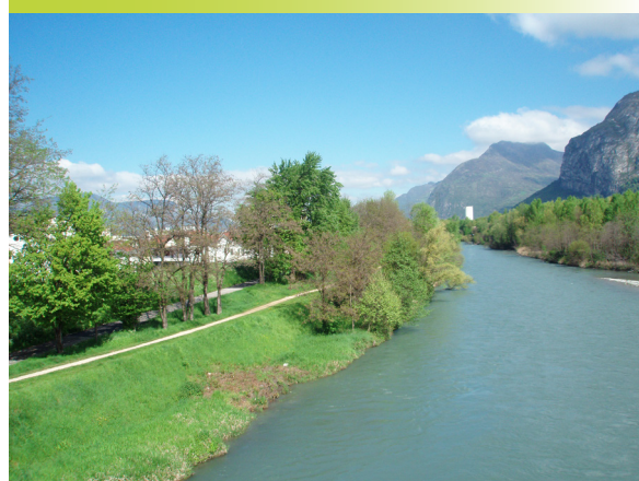
Une réflexion liant TVB et déplacements : le schéma piéton est déconnecté des voiries à grand trafic. Ici, un cheminement le long du Drac, très emprunté le week-end et pour les trajets domicile-travail.