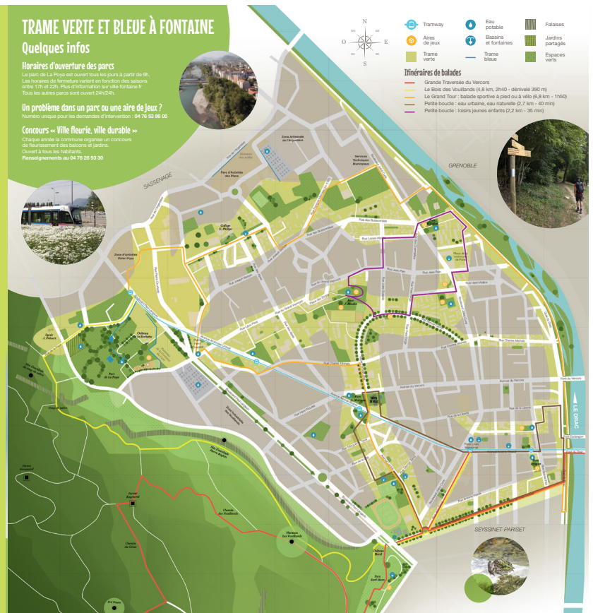
Action phare en matière de communication et de sensibilisation : la carte de la TVB, installée à l'entrée des parcs de la ville et participant à une TVB plus visible.