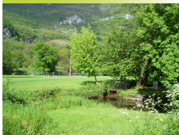
Parmi les actions renforçant la TVB de Fontaine : des mares accessibles à vocation pédagogique, des jardins collectifs et une prairie fleurie ont été créés. Ici, le parc de la Poya, qui renforce la connexion Vercors – Drac en « pas japonais ».