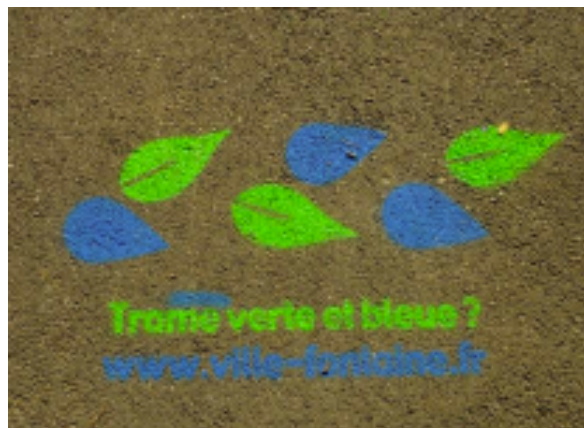
Pochoirs réalisés sur les trottoirs, lors de la quinzaine de la nature en ville.

La Ville prévoit la création de trame verte via l'aménagement d'espaces verts et, dès 2018, la prise en compte de la nature en ville via des diagnostics et inventaires écologiques. Enfin, des travaux de restauration de la trame bleue se matérialiseront par la création de bassins naturels ou la réouverture de ruisseaux.