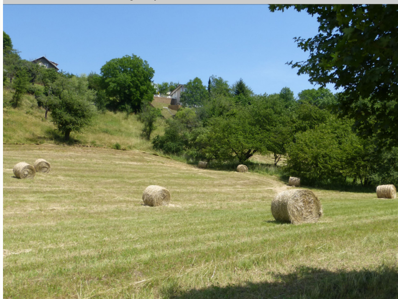
Entretien par la fauche (tardive) des coteaux du Vernand

Les travaux et études préliminaires à la réalisation de l'aménagement des coteaux du Vernand ont permis de trouver une espèce protégée au niveau national et européen : le crapaud sonneur à ventre jaune. A ce jour, après plusieurs années de concrétisation du projet, les crapauds sonneurs sont toujours présents sur le site et leurs effectifs sont en progression.