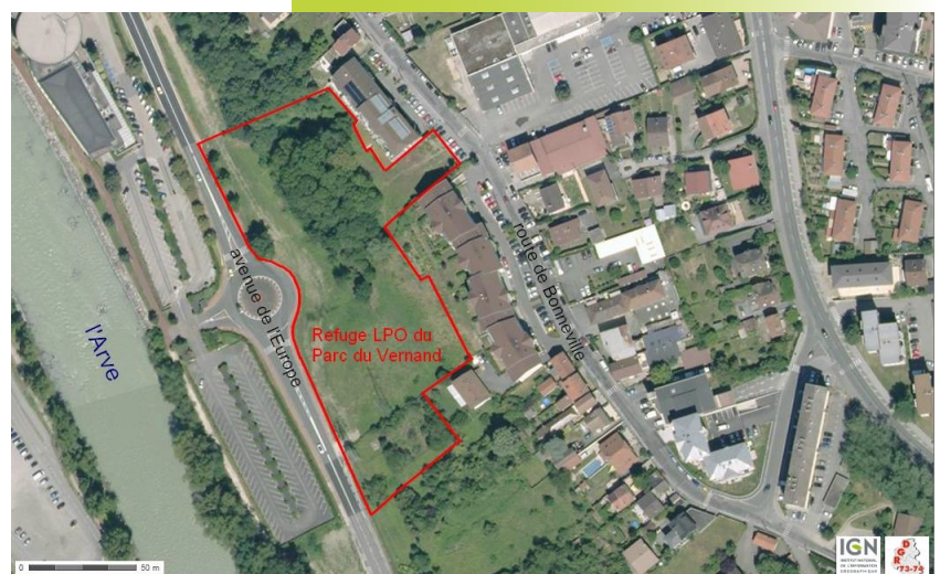
Localisation des coteaux du Vernand