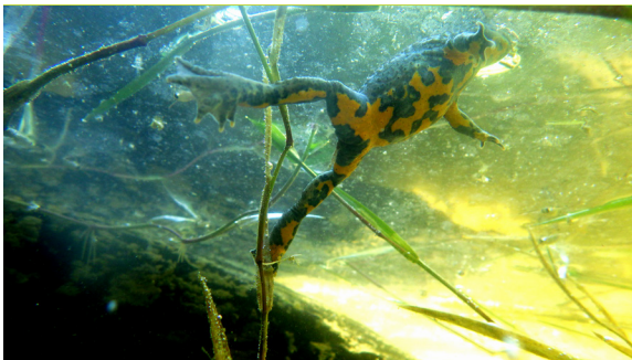
Sonneur à ventre jaune