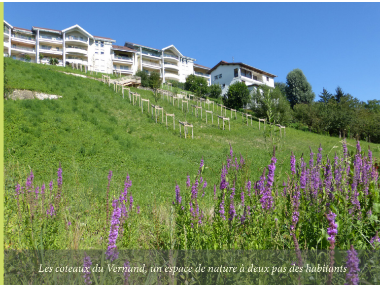
Les coteaux du Vernand, un espace de nature à deux pas des habitants