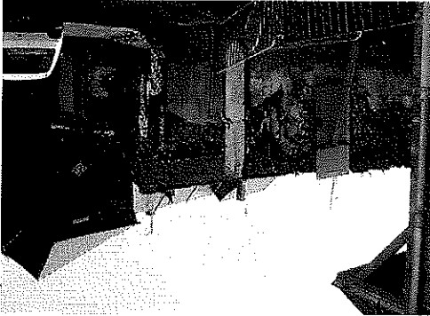
La ruelle des Juifs constitue un espace central public à requalifier.