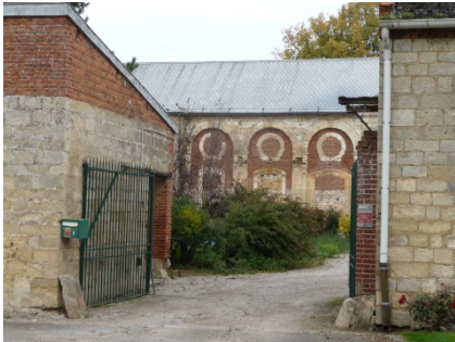
TABLEAU 2 ABBAYE ET DEPENDANCES

Plusieurs périodes de construction Matériaux et modénatures