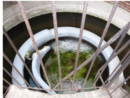
TABLEAU 3 L'EAU SOUS TOUTES SES FORMES

Sources d'eau potable, rivière et marais