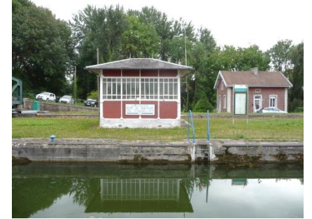
TABLEAU 4 LE TEMPS DES CANAUX

Cours sinueux, prairies drainées à saules