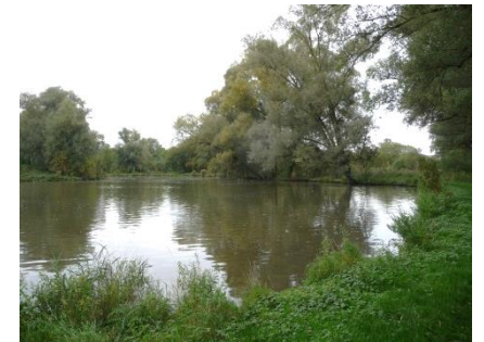
TABLEAU 5 JEU DE NIVEAUX, MAITRISE DE L'EAU

Digues, bassins, terrassements et chemins de l'eau