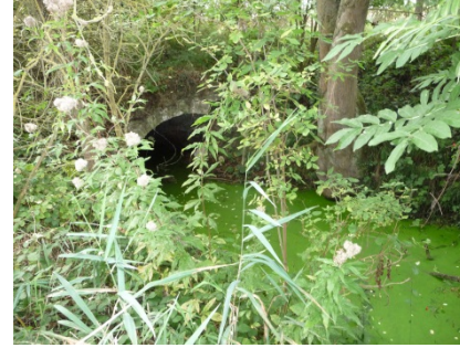
TABLEAU 4 MILIEUX RICHES, PAYSAGES CISELES

Milieus aquatiques, vues ouvertes sur la vallée