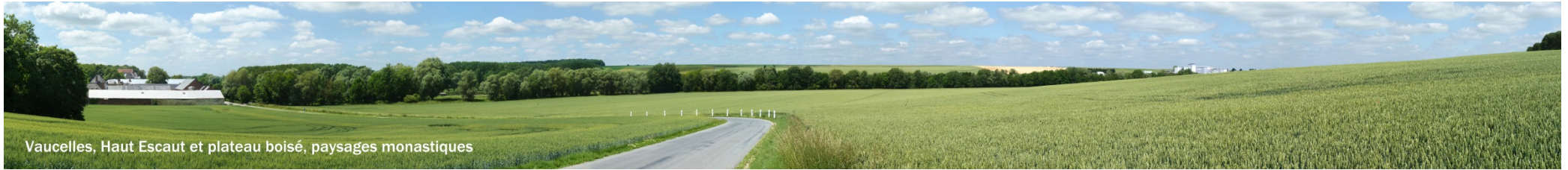
Vaucelles, Haut Escaut et plateau boisé, paysages monastiques