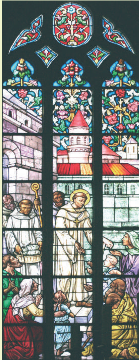
Église de Wormhout, « Saint Winoc donne argent et pain aux mendiants ».

Vendredi 29 et samedi 30 septembre 2017 Colloque à Bergues