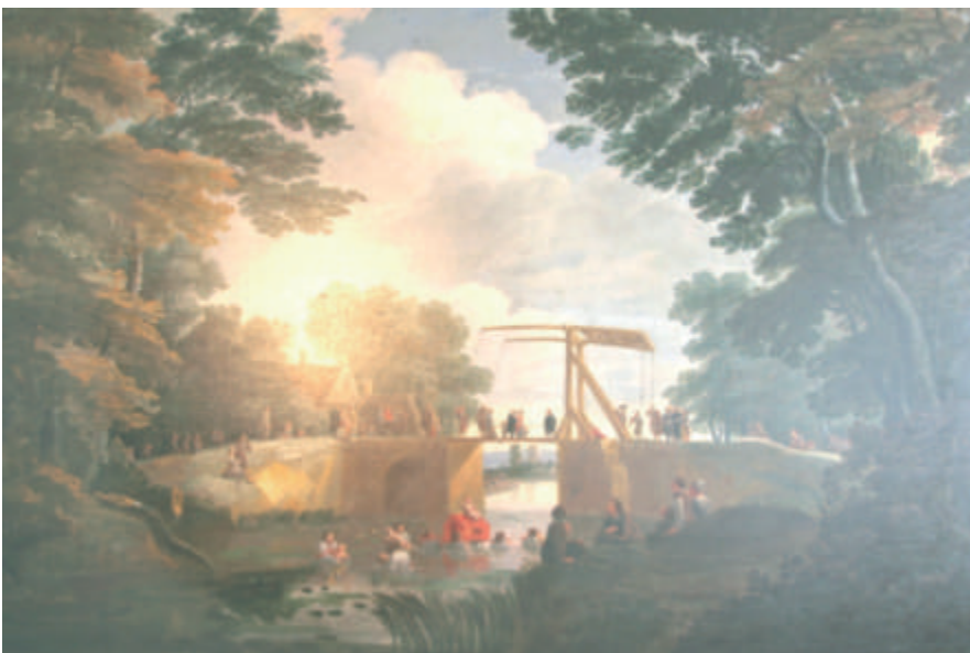
Musée de Bergues, J.-B. Van Meunynxhoven, « Le bain des reliques de saint Winoc ».

Le 4 août 1789, dîmes et rentes seigneuriales sont supprimées ; le 2 novembre, les propriétés sont déclarées biens nationaux. Les religieux sont chassés le 18 juin 1791. Les livres et œuvres d'art sont alors dispersés. Ils témoignent du haut niveau culturel des religieux. Les bâtiments furent vendus et détruits à l'exception de deux tours. Le site est actuellement occupé par un jardin public.