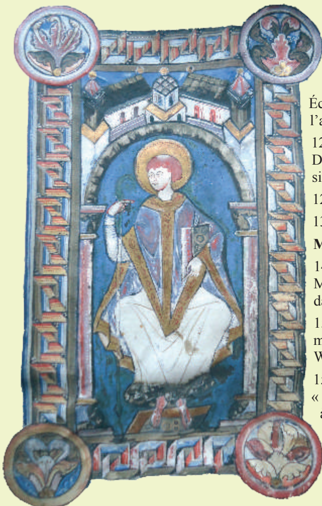
Bibliothèque de Bergues, Ms 19, saint Winoc.