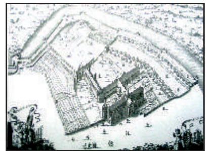
Gravure de 1635, abbaye de Saint-Winoc.