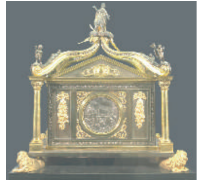
Musée de Bergues, chasse de saint Winoc.