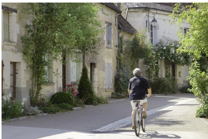
Rue du Lavoir « Après » ►