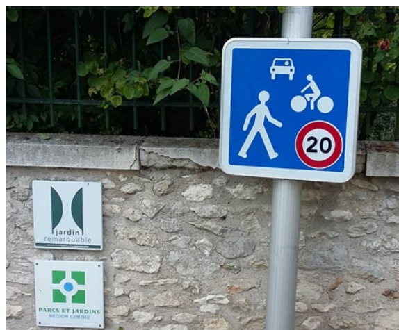
Le centre-bourg passe en zone de rencontre en 2014

Sur la rue du Lavoisier, les trottoirs ont été mis à niveau avec la chaussée, dans les autres, ils ont été conservés mais abondamment végétalisés.