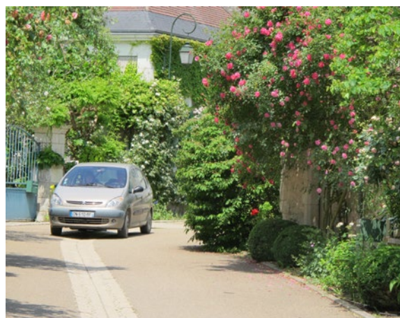
La végétalisation : un facteur essentiel dans la modification de la perception de la rue

Dans les deux cas, cela modifie radicalement l'ambiance des rues, réduit la largeur de la chaussée et agit sans conteste sur le ralentissement des véhicules. Les piétons, quant à eux, ne disposant plus d'espaces latéraux dédiés, s'autorisent plus naturellement à déambuler entre les façades.