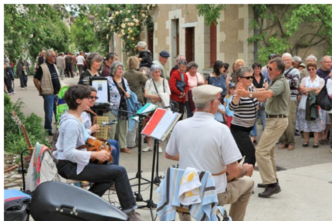
Lors du festival des Roses, musiciens, peintres et autres artistes investissent les rues

D'autres festivals ont animé, ou animent, le village de Chédigny : Festival de blues ; Festival de Bouche et d'Oreille... Autant de rendez-vous appréciés par le public local mais aussi par les nombreux touristes.