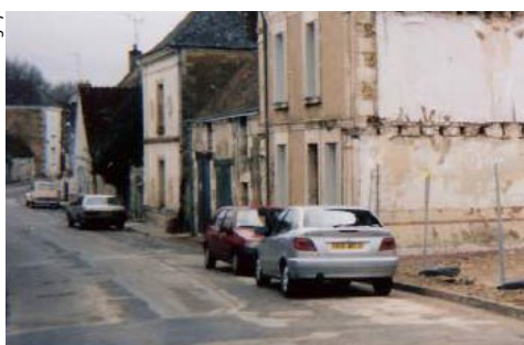
▲ Rue du Lavoir « Avant »