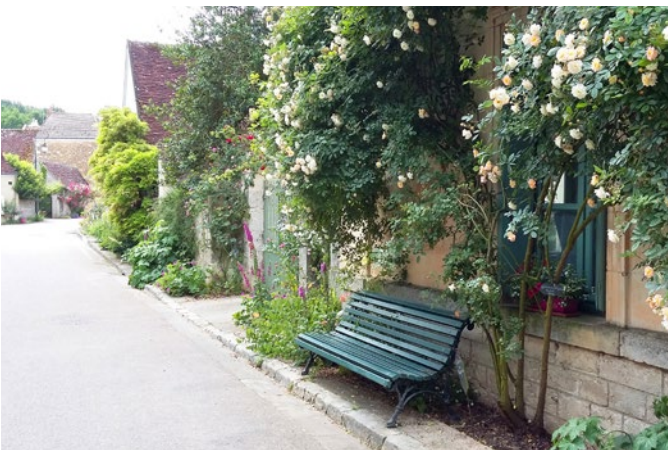
En pied de façade, rosiers et vivaces. Mais aussi des bancs

À Chédigny, l'aménagement des frontages a commencé par la plantation de rosiers grimpants sur les trottoirs, en pied de façades. Celle-ci s'est faite avec la collaboration du rosériste André Eve, spécialisé dans la conservation et la redécouverte des roses anciennes.