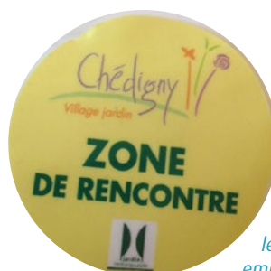
Un macaron apposé sur le pare-brise permet d'identifier les véhicules autorisés à emprunter la rue du Lavoir

Sud, interdite à la circulation automobile sauf pour les ayants droits (habitants du bourg et des hameaux de Chédigny). Le trafic de transit, environ 300 véhicules/jours, est ainsi invité à contourner le centre par l'ouest, en empruntant la RD 25, limitée à 50 km/h.