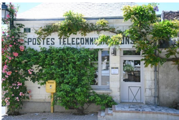
Une agence postale a été ré-ouverte en 2019. Auparavant seul un point poste était assuré par un restaurant

Si la population est globalement vieillissante, des jeunes s'installent à nouveau. De ce fait l'école maternelle a été maintenue. Et lorsque les enfants se rendent au centre de loisirs, c'est en pédibus, autrement dit en convoi à pied, accompagnés par des adultes, qu'ils empruntent la rue principale.