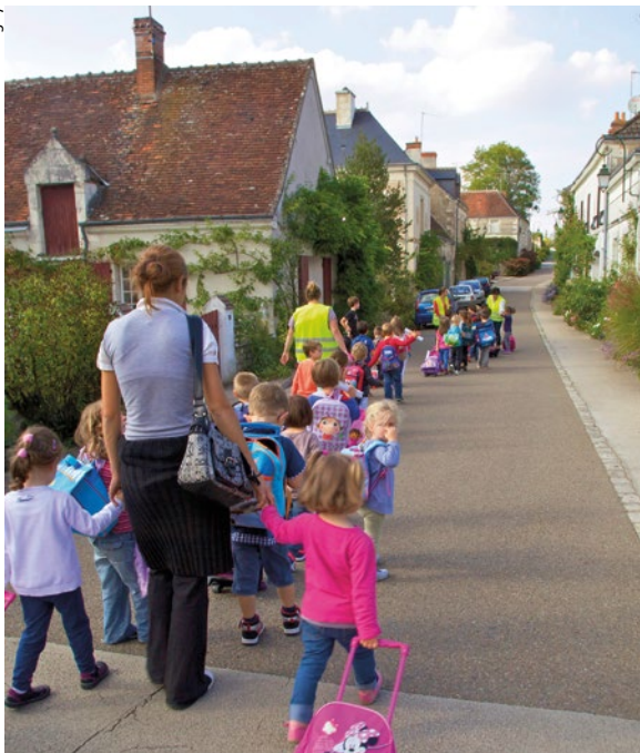
Le Pédibus emprunte la zone de rencontre pour se rendre au centre de loisirs

Si la population est globalement vieillissante, des jeunes s'installent à nouveau. De ce fait l'école maternelle a été maintenue. Et lorsque les enfants se rendent au centre de loisirs, c'est en pédibus, autrement dit en convoi à pied, accompagnés par des adultes, qu'ils empruntent la rue principale.