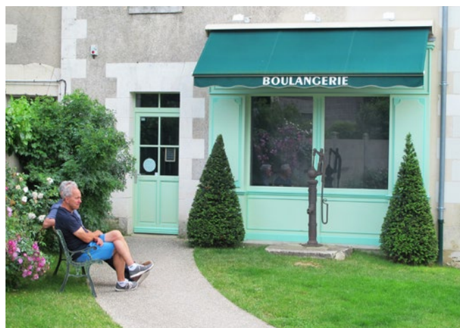
Ouverture d'une boulangerie en 2015

Réalisé à fin des années 1990, l'aménagement principal de la traverse du bourg, d'un linéaire de 300 m, s'est chiffré à environ 300 000 € (hors enfouissement des réseaux), auxquels se sont rajoutés environ 35 000 € pour les plantations