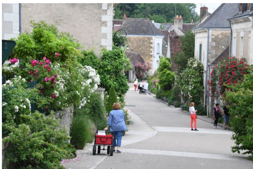
Rue du Lavoir « Après » ►