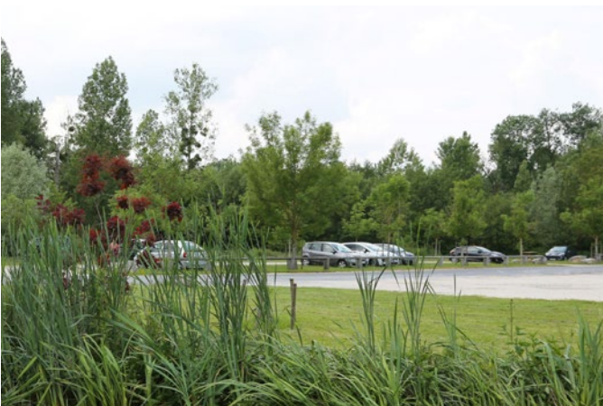
Vaste parking en entrée du bourg. Les visiteurs sont invités à y stationner et à poursuivre à pied