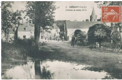
▲ Rue Chante l'Indrois « Avant » ▼