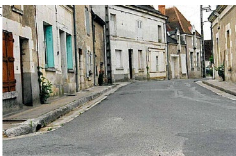
▲ Rue du Lavoir « Avant »