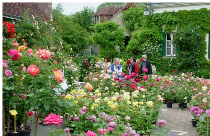
L'espace public accueille à cette occasion une soixantaine d'exposants : rosiéristes, pépiniéristes producteurs, artisans liés au jardin

L'aménagement des rues du centre-bourg, l'apaisement des circulations motorisées, la création de grands parkings en entrées, profitent tout au long de l'année aux habitants. L'ensemble crée aussi un cadre particulièrement bien adapté à l'accueil de ce type d'évènements. L'accès motorisé au centre est alors neutralisé et les espaces publics sont mis à la disposition complète des exposants, artistes et visiteurs.