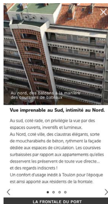
Contenus de médiation

L'application permet également la visite virtuelle de lieux inaccessibles au public , comme la salle d'apparat de l'ancienne Caisse d'Épargne ou la vue depuis le sommet de l'Hôtel de Ville !