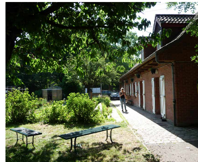
Ferme pédagogique Marcel Dhenin