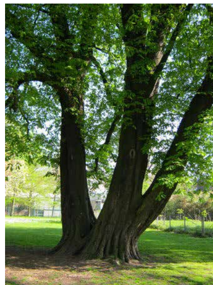
Marronnier survivant des travaux