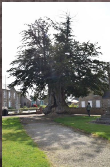
Santé de l'arbre