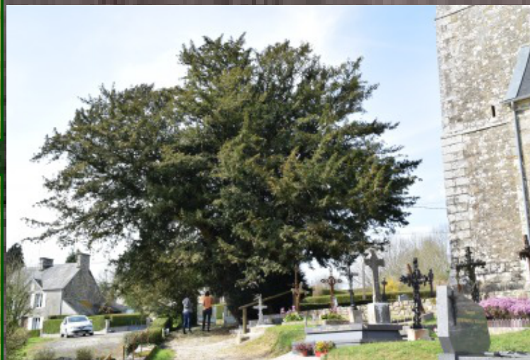
Caractère(s) remarquable(s) de l'arbre