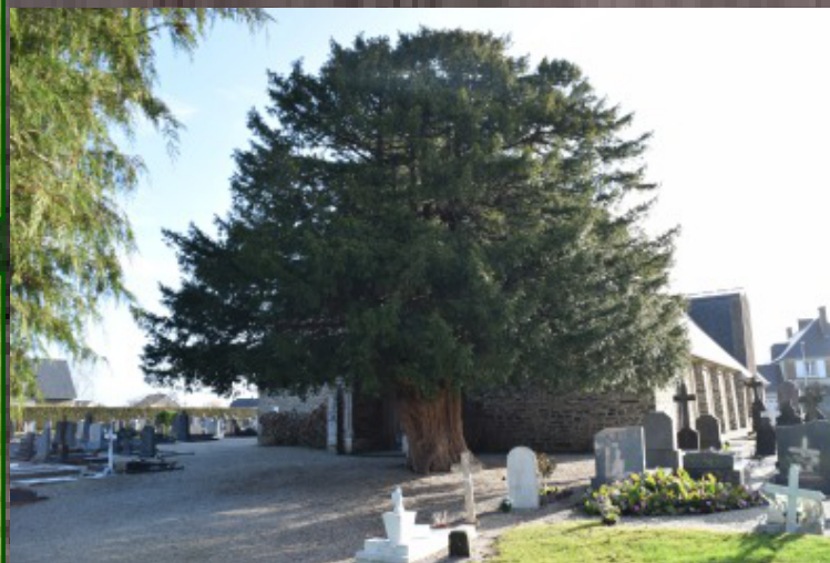
Caractère(s) remarquable(s) de l'arbre