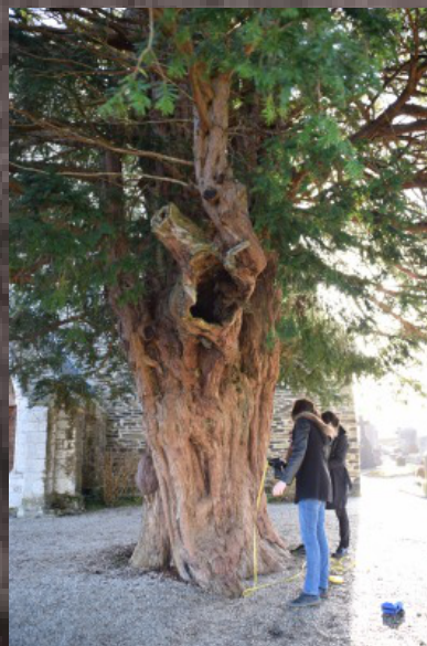
Environnement de l'arbre