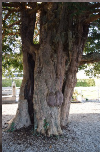
Santé de l'arbre