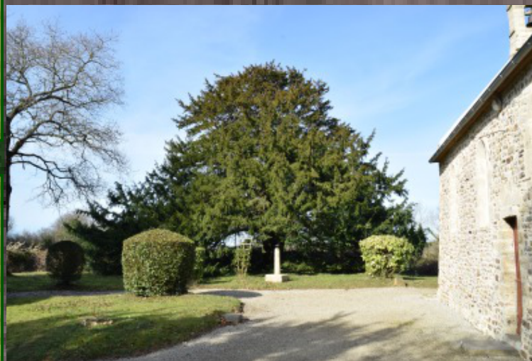
Caractère(s) remarquable(s) de l'arbre