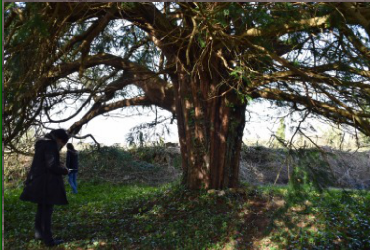
Santé de l'arbre